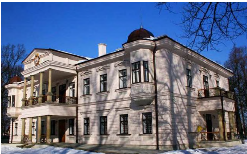
Pałac Załuskich w Iwoniczu wzniesiony w 1840 roku