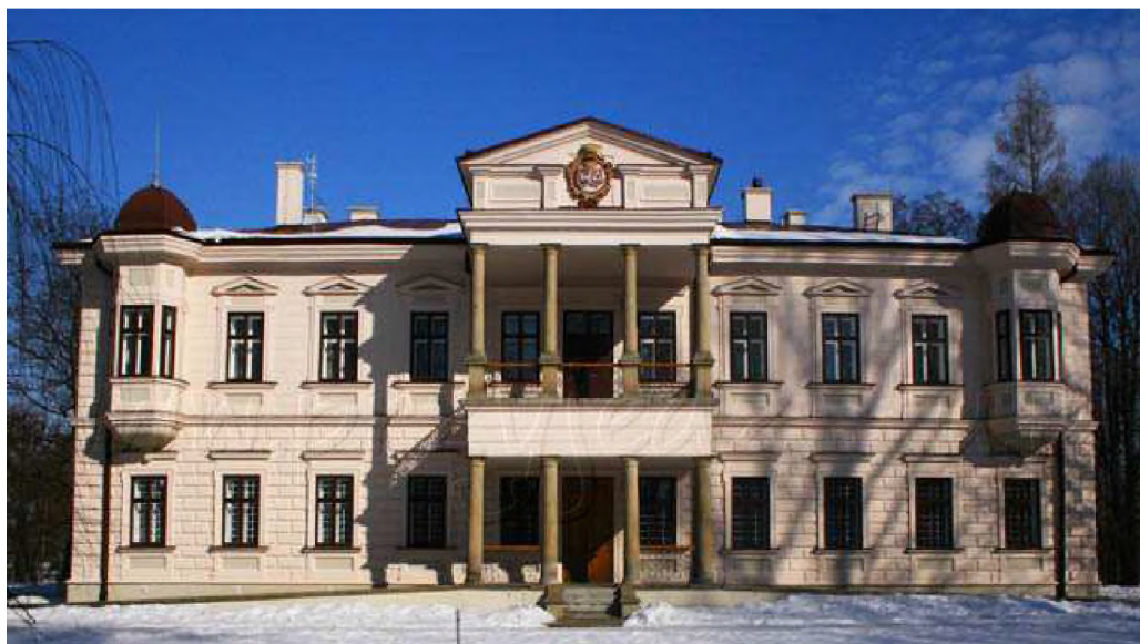
Pałac Załuskich w Iwoniczu

Międzynarodowe Centrum Edukacji Ekologicznej Uniwersytetu Rzeszowskiego jest idealnym miejscem do organizacji różnego rodzaju konferencji, spotkań, seminariów oraz zajęć dydaktycznych.