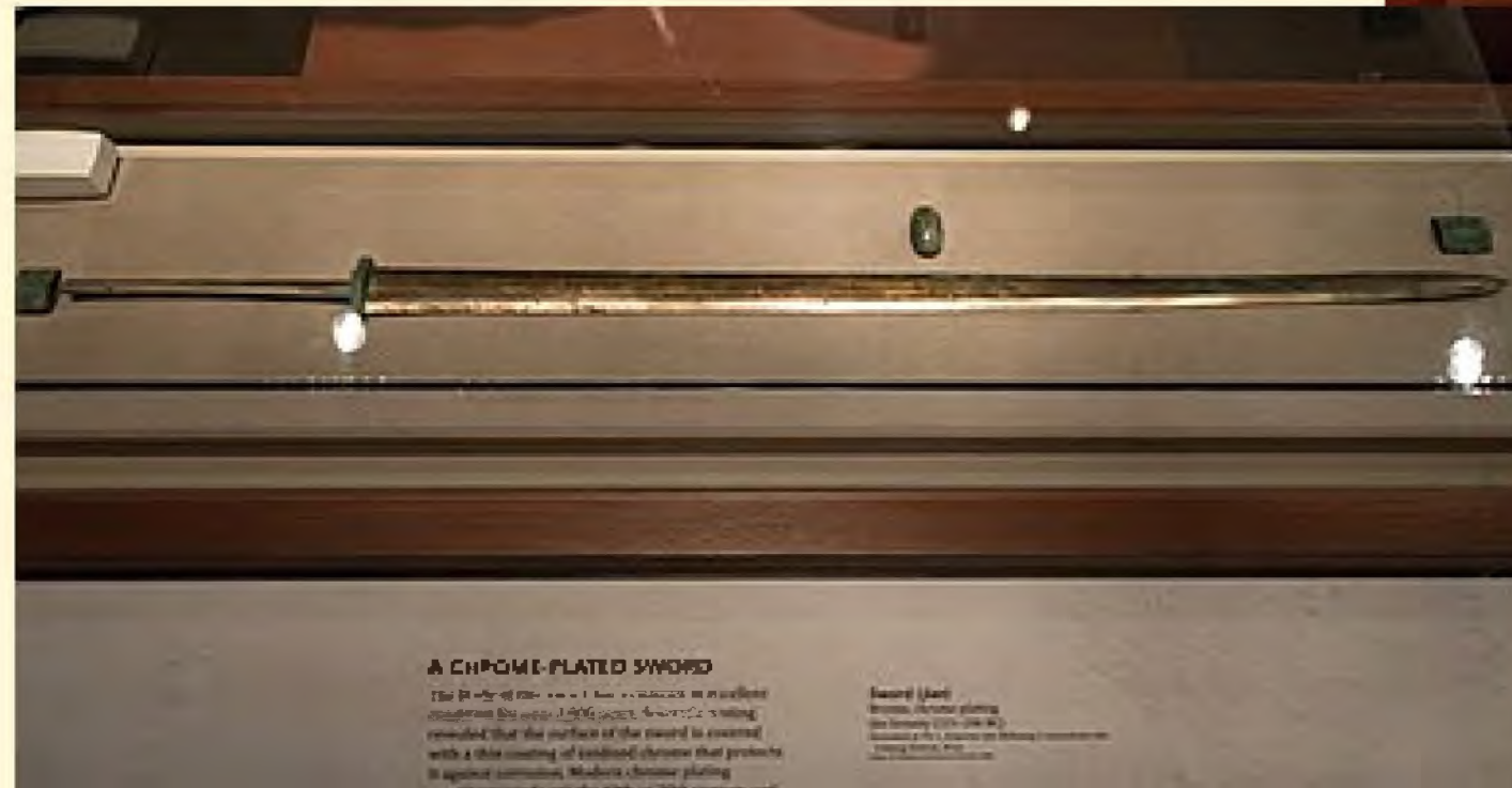
A CHROME-PLATED SWORD The first of the sword's surface was made of copper. In 1970, a scientist's testing revealed that the surface of the sword is coated with a thin coating of natural chrome that protects it against corrosion. Modern chrome plating. Sword (Jian) Bronze, lacquer plating Six Dynasties (589-618 AD) Shanghai Museum, Shanghai, China