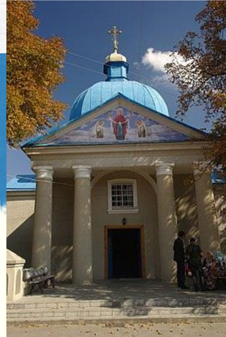
Церква Покрови Божої Матері в Первомайську

Пам'ятка Миколаєва кінця XVIII та XIX ст., м.ін р.: Костел Святого Йосипа