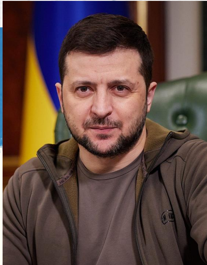
Володимир Олександрович Зеленський

Український політик, сатирик, актор, сценарист, телеведучий. Людина року за версією журналу Time у 2022 році.