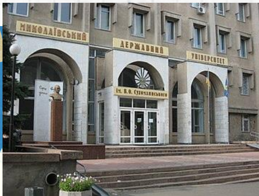
Миколаївський національний університет імені Василя Сухомінського

Найстаріший університет міста. Навчання ведеться за різними спеціальностями на 6 факультетах та 4 інститутах.