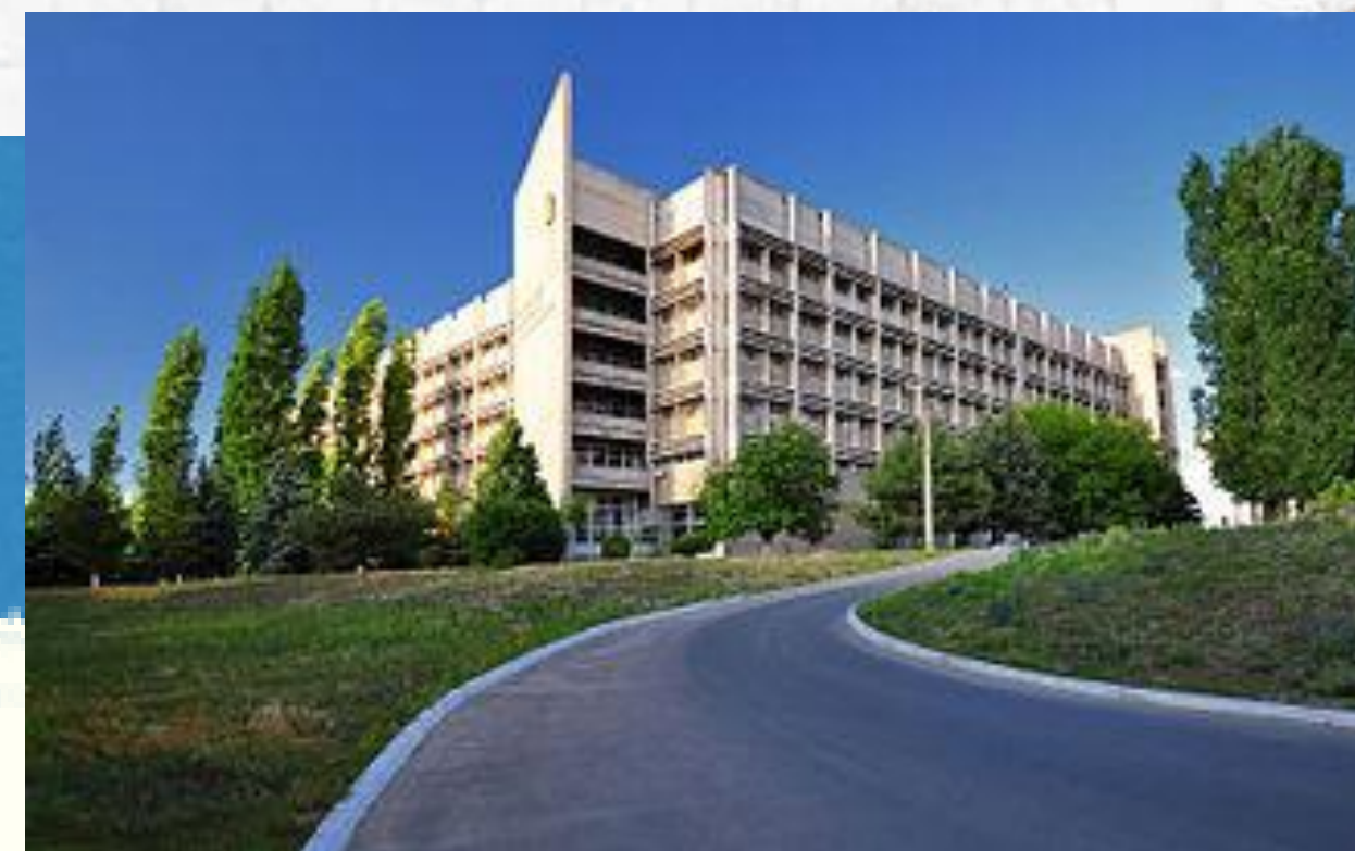
Національний університет кораблебудування імені адмірала Макарова Заклад, який готує фахівців для суднобудування та суміжних галузей промисловості України. Університет названий на честь російського адмірала Степана Макарова, який народився в місті.

Найстаріший університет міста. Навчання ведеться за різними спеціальностями на 6 факультетах та 4 інститутах.