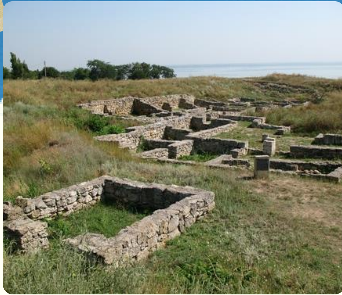
Залишки давньогрецького міста Ольвія