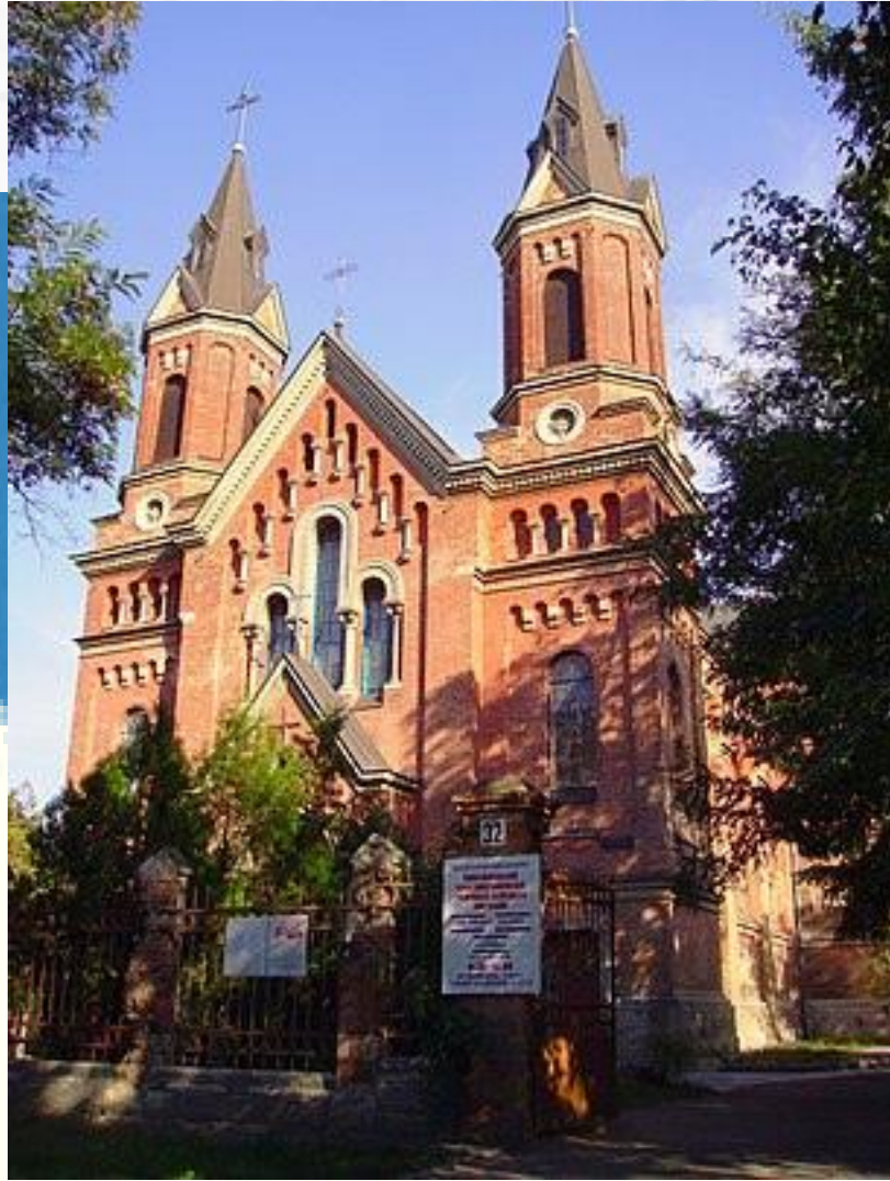
Церква Святого Йосипа

Пам'ятка Миколаєва кінця XVIII та XIX ст., м.ін р.: Костел Святого Йосипа