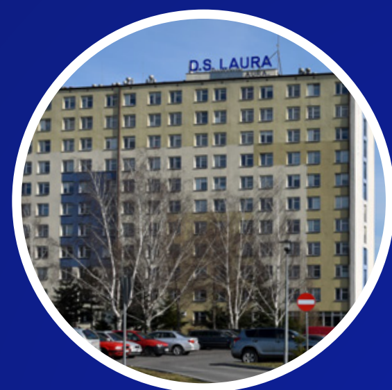
Dom Studencki „Laura” ul. Cicha 2 tel.: +48 17 872 22 00 e-mail: dslaura@ur.edu.pl

Uniwersytet Rzeszowski dysponuje miejscami w pięciu domach studenckich.