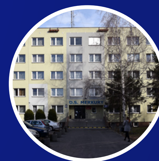
Dom Studencki „Merkury” ul. Ćwiklińskiej 2B tel.: +48 17 861 40 00 e-mail: radmz@ur.edu.pl