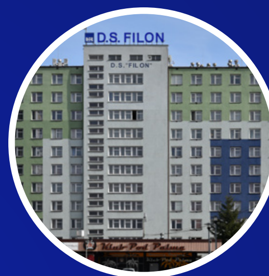
Dom Studencki „Filon” ul. Cicha 4 tel.: +48 17 872 34 00 e-mail: dsfilon@ur.edu.pl