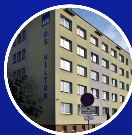
Dom Studencki „Hilton” ul. Ćwiklińskiej 2C tel.: +48 17 861 40 01 e-mail: radmz@ur.edu.pl