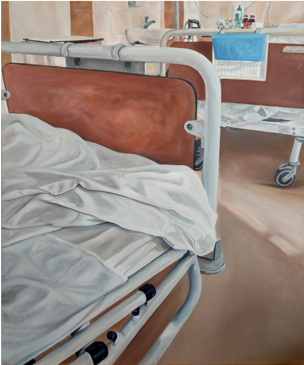
HOSPITALIZACJA 9 - 10 olej na płótnie, 100 x 120 cm