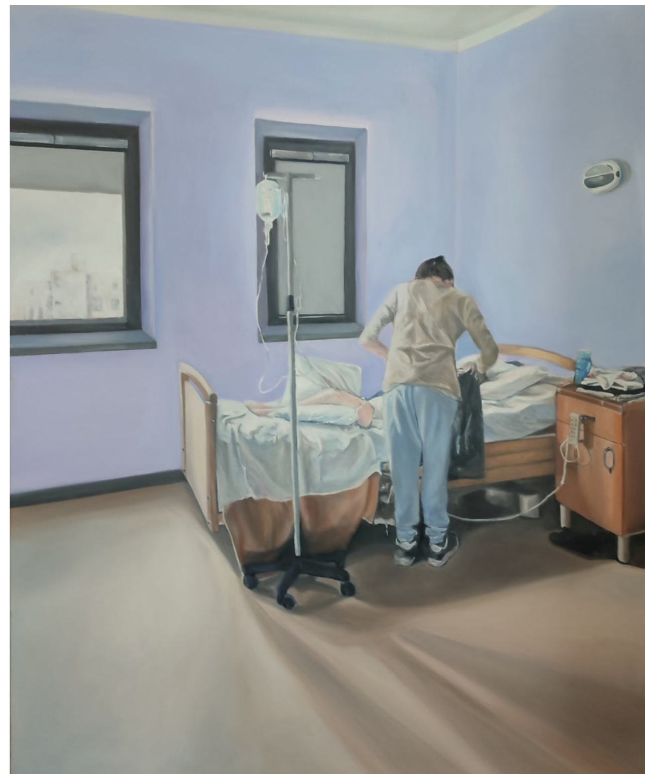
HOSPITALIZACJA 2 - 10 olej na płótnie, 100 x 120 cm