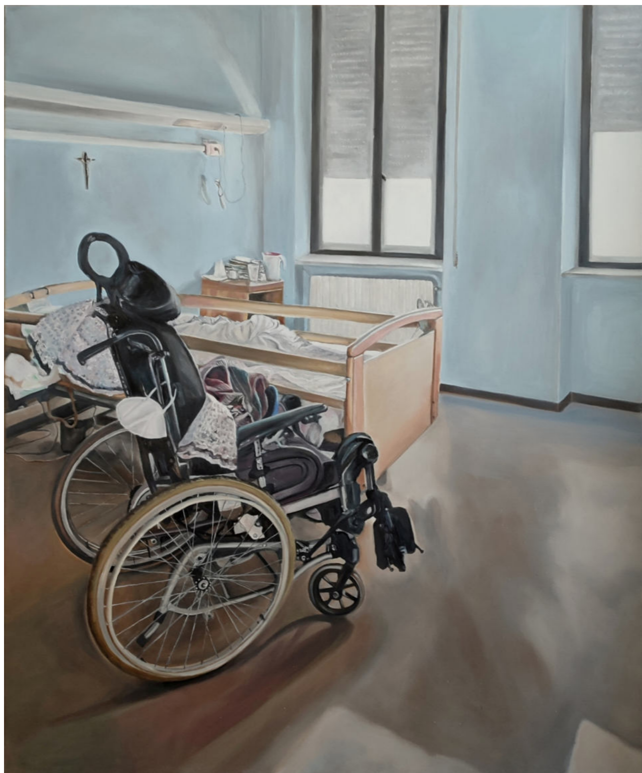
HOSPITALIZACJA 7 - 10 olej na płótnie, 100 x 120 cm