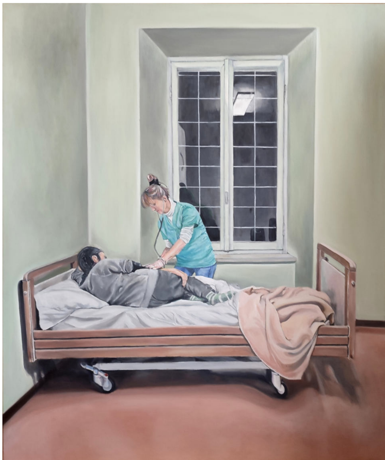
HOSPITALIZACJA 3 - 10 olej na płótnie, 100 x 120 cm