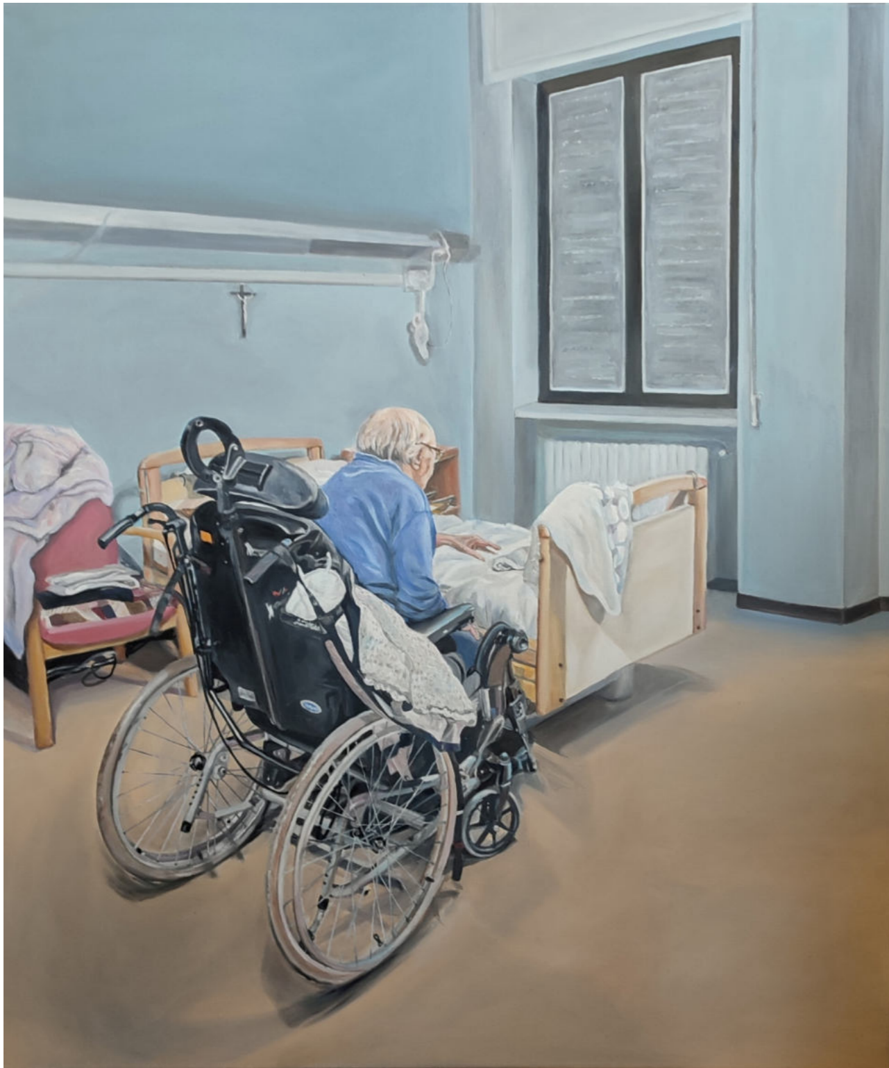
HOSPITALIZACJA 5 - 10 olej na płótnie, 100 x 120 cm