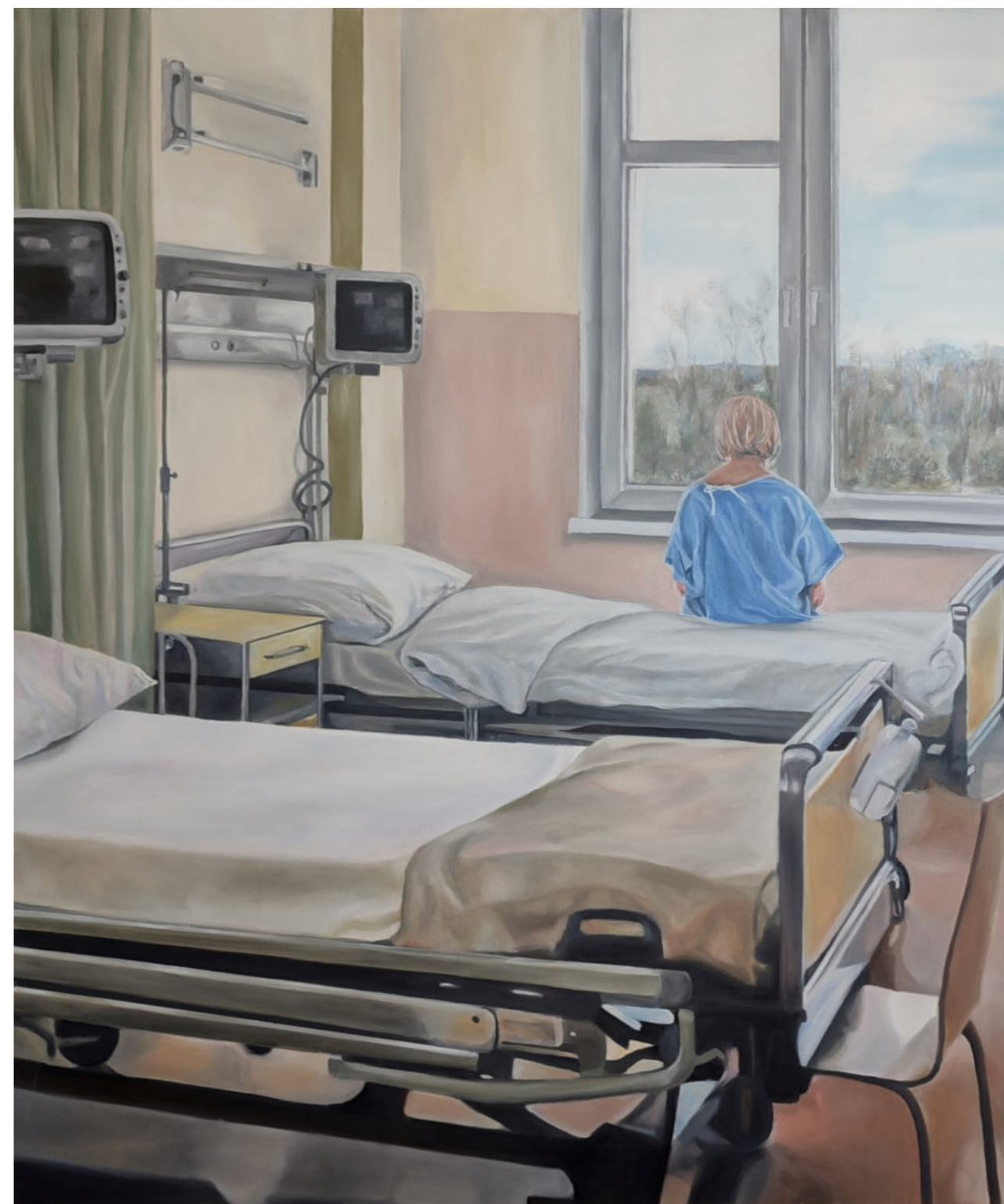
HOSPITALIZACJA 4 - 10 olej na płótnie, 100 x 120 cm