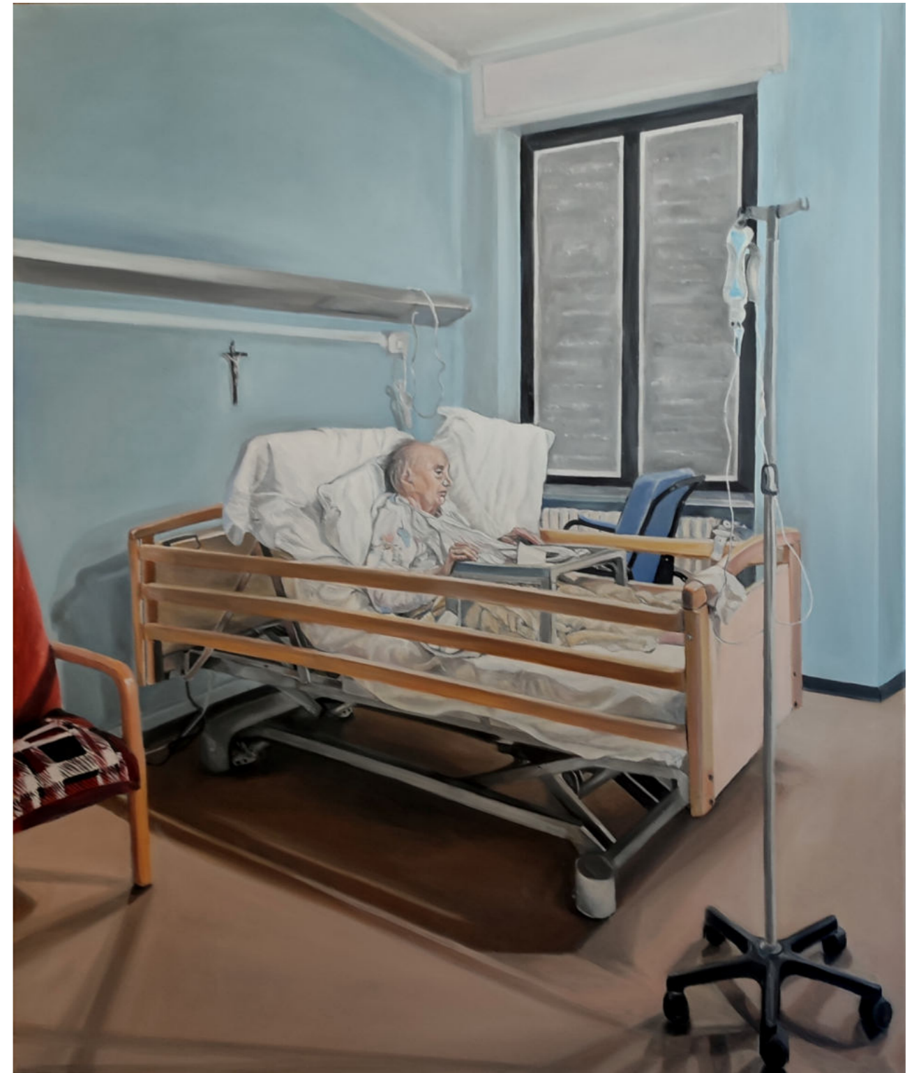
HOSPITALIZACJA 6 - 10 olej na płótnie, 100 x 120 cm