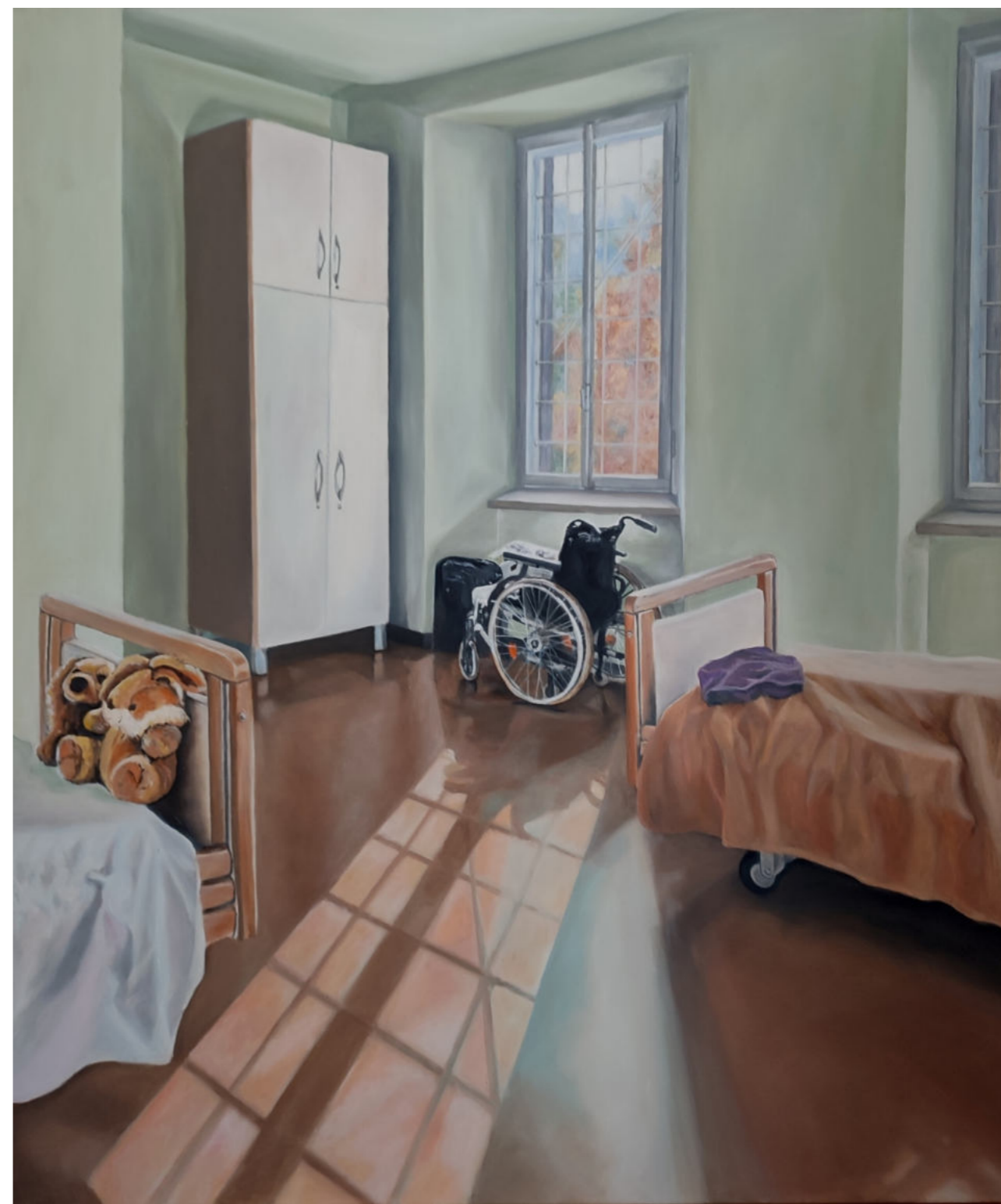
HOSPITALIZACJA 8 - 10 olej na płótnie, 100 x 120 cm