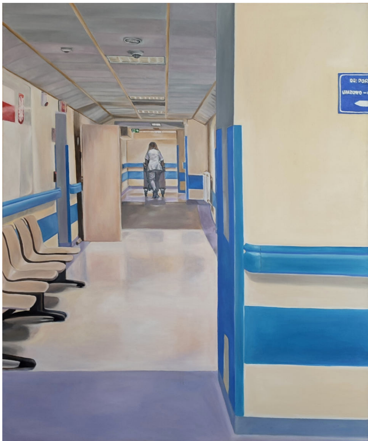
HOSPITALIZACJA 1 - 10 olej na płótnie, 100 x 120 cm