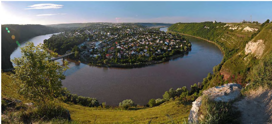
Фото 11. Панорама Національного природного парку “Дністровський каньйон” [34]

Територією Тернопільщини протікає одна з найкрасивіших у Європі і друга за величиною в Україні – річка Дністер (фото 11).