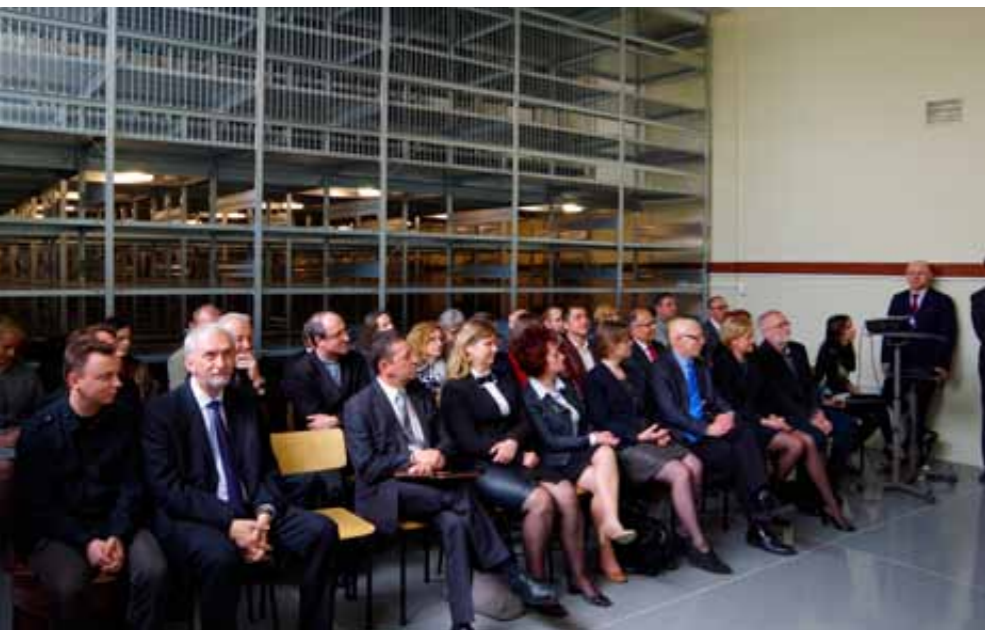
Regały w Uniwersyteckiej Składnicy Materiałów Archeologicznych

Uroczyste otwarcie Uniwersyteckiej Składnicy Materiałów Archeologicznych.