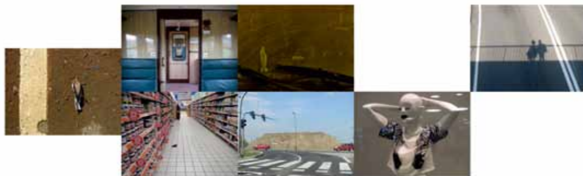
A. Gontarz, Projekt Szczęście / Miłość