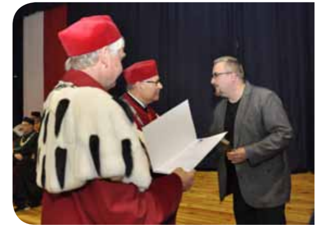
Fot. J. Zydroń

wyróżnienie w obszarze sztuki – dr Łukasz Cywicki .