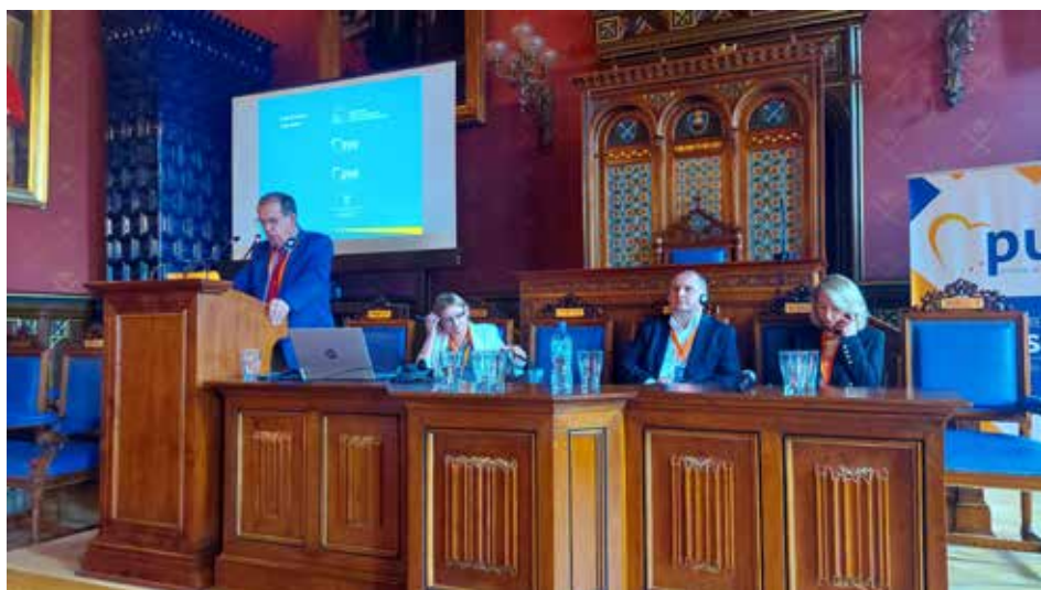
Panel dyskusyjny: Nowoczesne technologie a potrzeby seniorów

W kolejnym numerze Biuletynu zamieszczone zostaną relacje z przebiegu paneli dyskusyjnych.