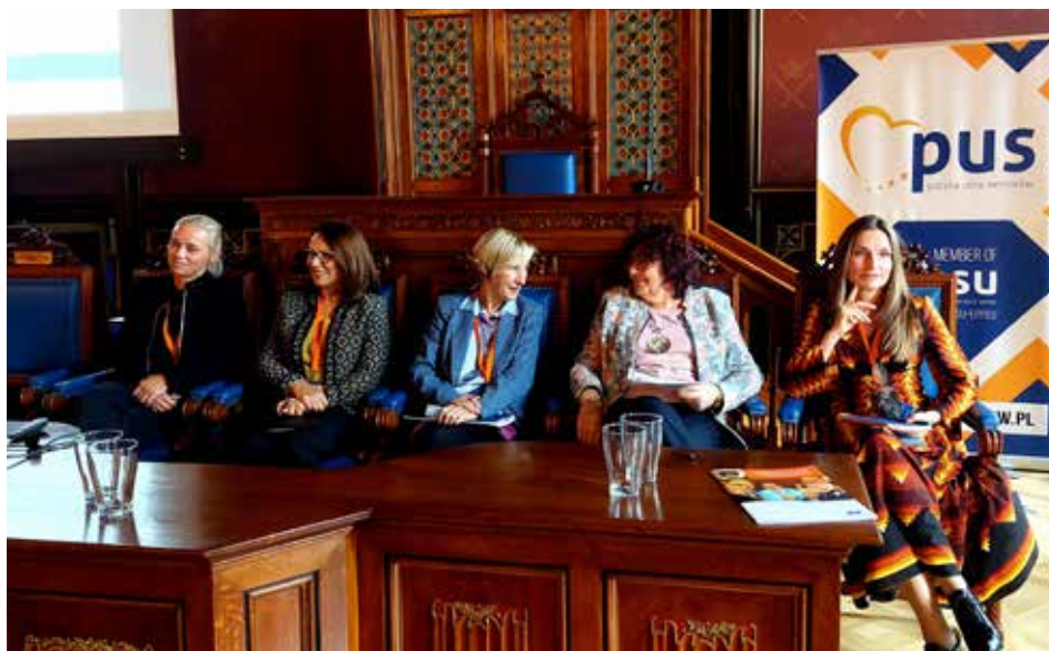
Dyskusja: Problemy i wyzwania polityki senioralnej – propozycje rozwiązań

Program na rzecz Aktywności Społecznej Osób Starszych na lata 2012-2013, powołano Radę ds. Polityki Senioralnej, a następnie powstał dokument rządowy „Założenia długofalowej polityki senioralnej w Polsce na lata 2014-2020”. Wiele osób na sali, przedstawiciele naszych organizacji – Uniwersytetów Trzeciego Wieku oraz organizacji pozarządowych działających na rzecz seniorów jak również ze środowiska naukowego Uniwersytetu Jagiellońskiego oraz środowiska samorządowego i wielu instytucji uczestniczyło w tych pracach. To był wyjątkowy