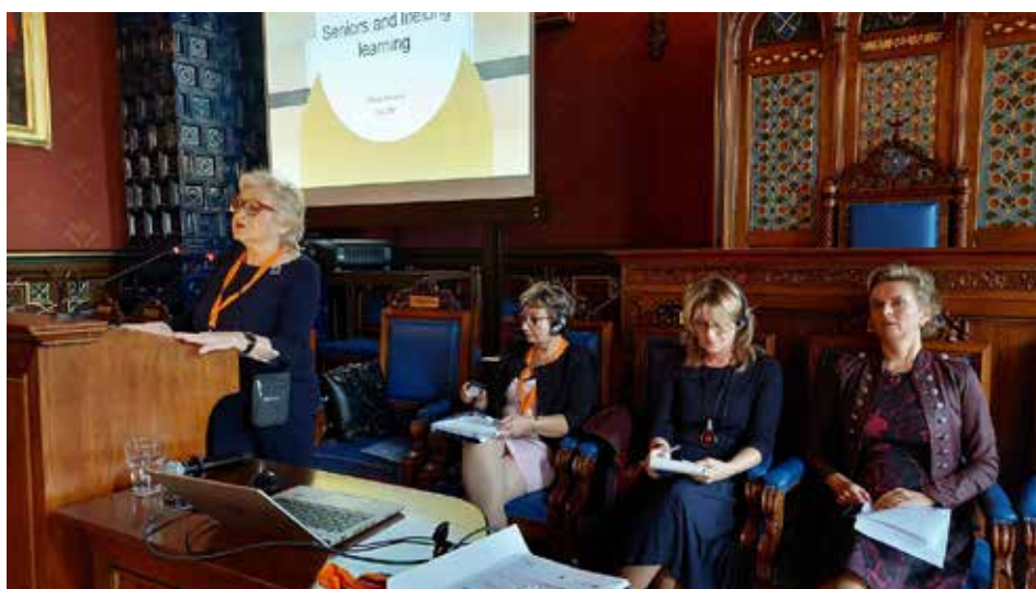
Panel dyskusyjny: Edukacja seniorów – Lifelong Learning – wyzwania dla organizacji seniorskich i ich liderów związane z pandemią