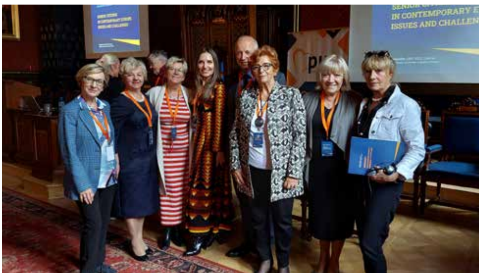
Goście i prelegenci konferencji

środowiskach lokalnych, ale i również na szczeblach regionalnych, ogólnokrajowych i międzynarodowych. Proszę państwa, mam ten zaszczyt, że uczestniczyłam w zespołach, które w Polsce w 2012 roku, kiedy Unia Europejska ogłosiła ten rok Europejskim Rokiem Aktywności Osób Starszych i Solidarności Międzypokoleniowej (decyzja Parlamentu Europejskiego oraz Rady nr 940/2011/UE z dnia 14 września 2011 r.) zaczęły pracować w naszym kraju nad utworzeniem polityki senioralnej. I powstał Rządowy