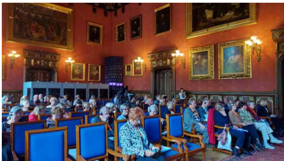
Uczestnicy konferencji

rym się znajdujemy, nie jest aż tak stary jak sam Uniwersytet. Przypominę, że Uniwersytet ma prawie 670 lat, ten budynek jest młodszy, z końca XIX wieku.” „Jak państwo widzą w auli jest wiele pięknych obrazów, głównie portrety rektorów Uniwersytetu Jagiellońskiego poprzednich lat. Warto tę salę pod tym kątem obejrzeć. Warto zobaczyć również oryginalny obraz Jana Matejki z Mikołajem Kopernikiem. W przyszłym roku rozpoczynamy Rok Kopernikański. Kopernik miał okazję studiować w Krakowie również na