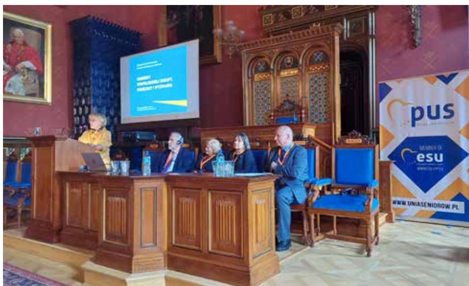
Panel dyskusyjny: Problemy ochrony zdrowia i opieki nad seniorami – sytuacja w krajach UE w okresie pandemii COVID-19