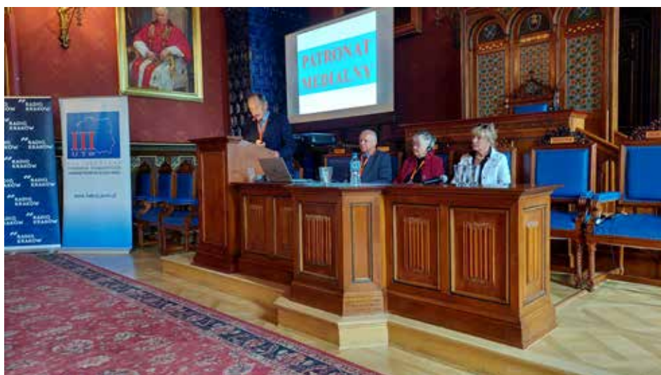
Panel dyskusyjny: Aktywność fizyczna seniorów – dobre praktyki, fot. archiwum OFSUTW

dokument, o wymiarze ogólnokrajowym, ale i również europejskim. Ukazane w nim zostały konieczne działania z zakresu polityki senioralnej w Polsce oraz potrzeba ich planowania w dłuższej perspektywie, w nawiązaniu do doświadczeń europejskich. Korzystając z danych Głównego Urzędu Statystycznego i EUROSTAT-u, można stwierdzić, że starzenie się społeczeństw w naszych krajach jest wyzwaniem XXI wieku, a także szansą dla wszystkich. Mam nadzieję, że konferencja też przysłuży się temu. Bardzo dziękuję za uwagę.