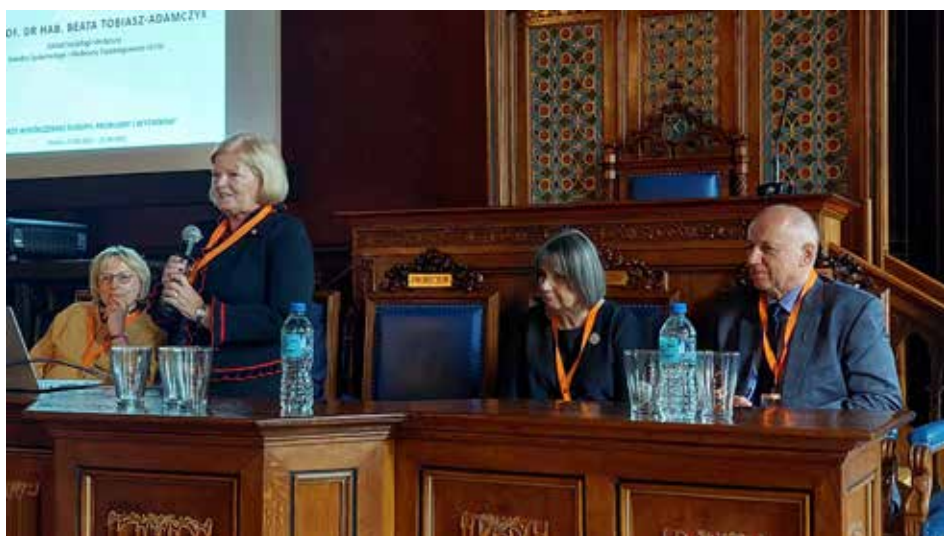
Panel dyskusyjny: Problemy ochrony zdrowia i opieki nad seniorami – sytuacja w krajach UE w okresie pandemii COVID-19