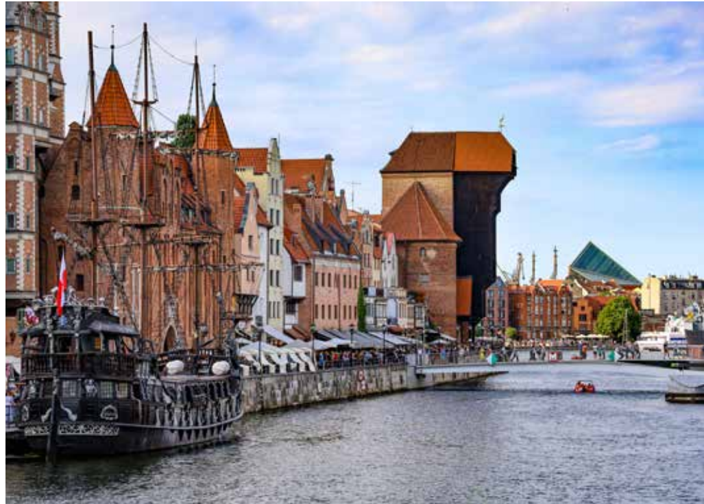
Gdańska Starówka

Uczestnicy Forum z zainteresowaniem wysłuchali informacji o standardach działania UTW w Polsce oraz o realizowanych przez Ogólnopolską Federację Stowarzyszeń UTW projektach szkoleniowych i konferencjach dla przedstawicieli środowiska UTW