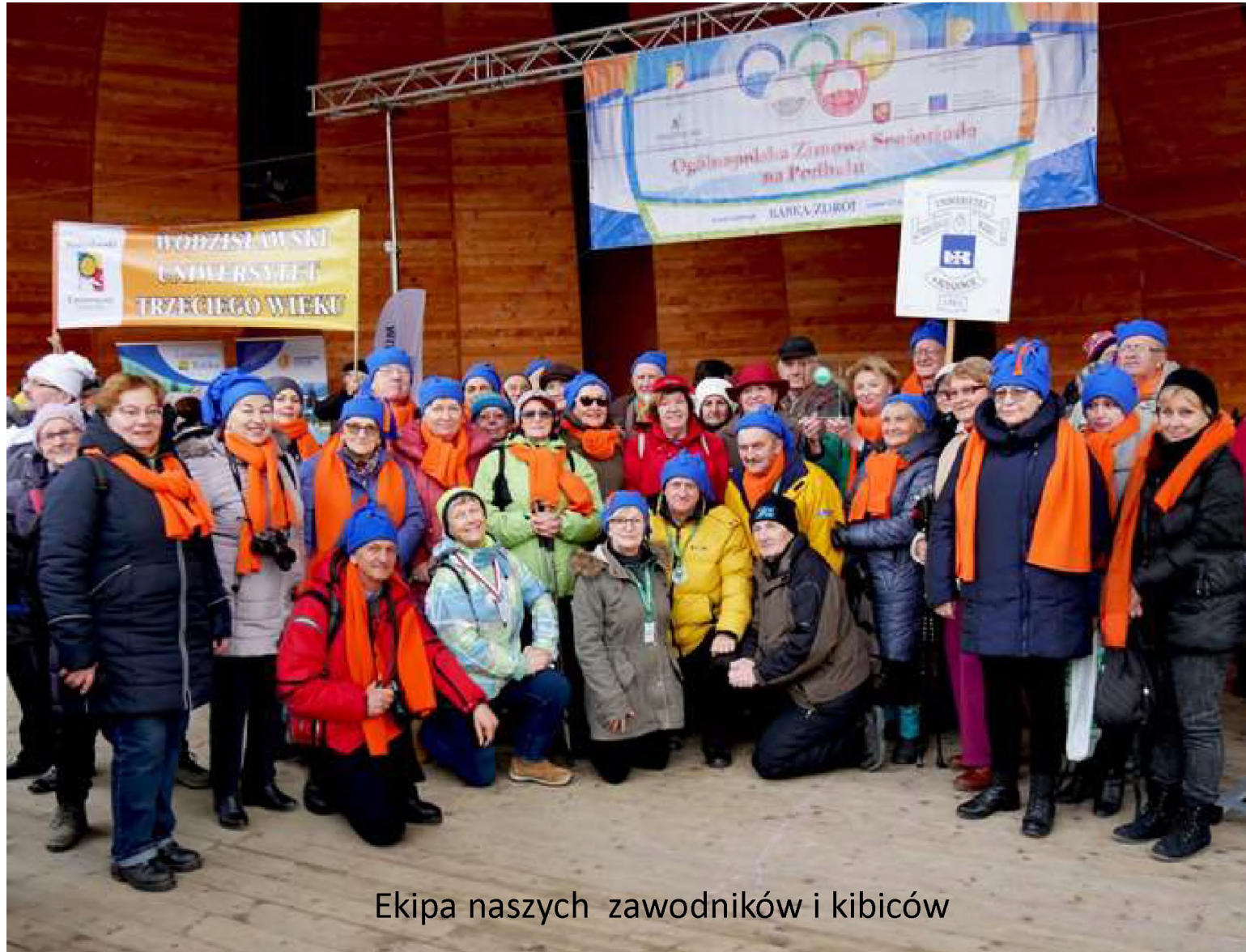
Ekipa naszych zawodników i kibiców