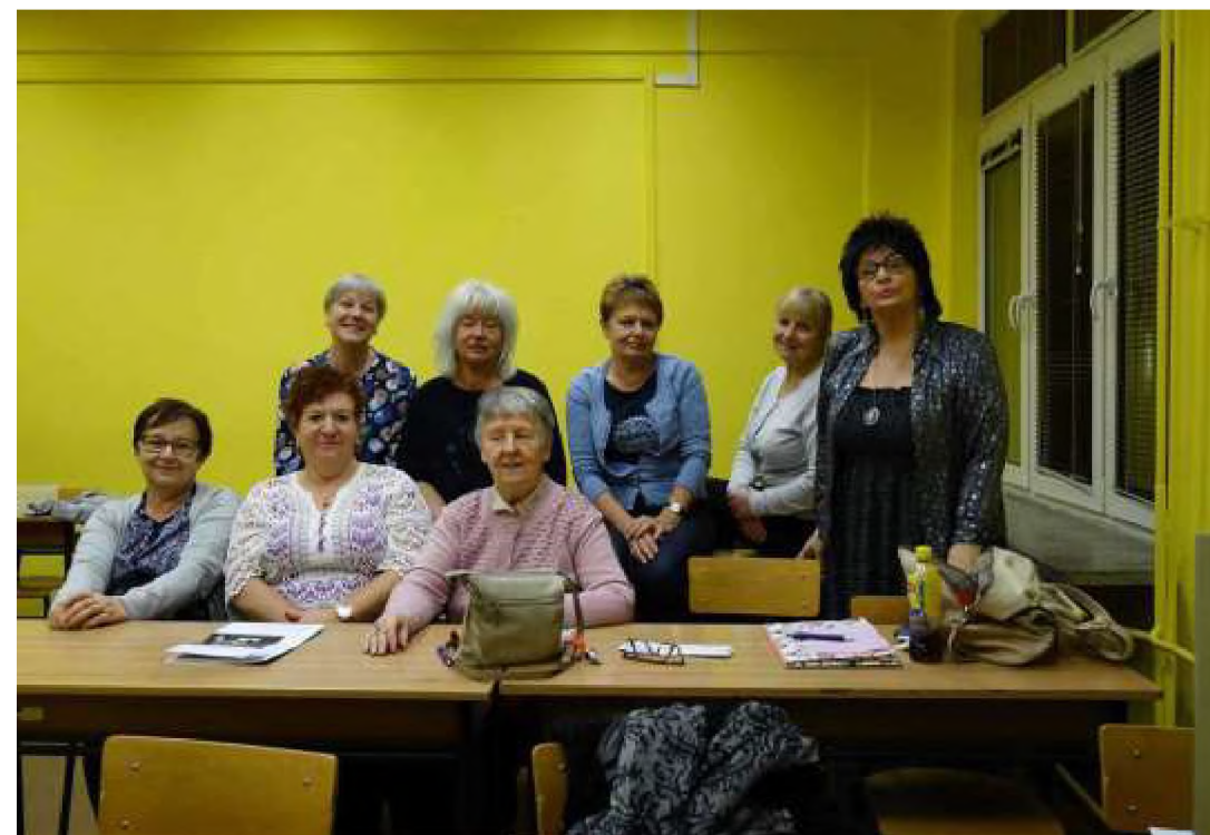
Warsztaty aktorskie w salach na Uczelni i przygotowanie kolejnych występów