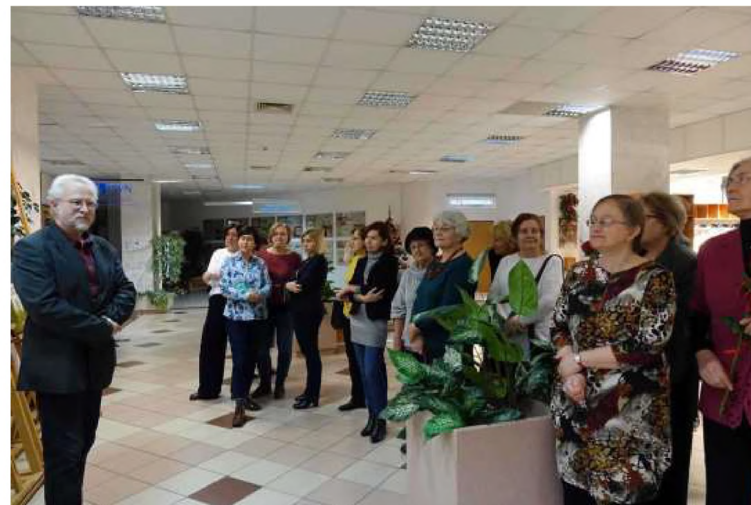
Zajęcia warsztatowe z instruktorem w salach na Uczelni i wystawy dorobku naszych malarzy