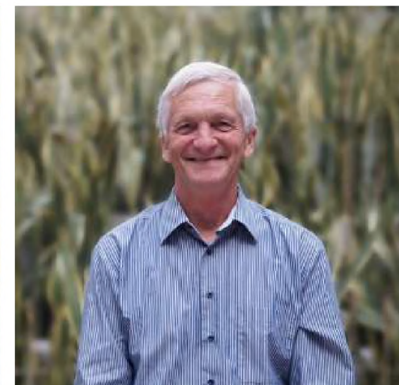
Jan Stachura Specjalista od fotografii