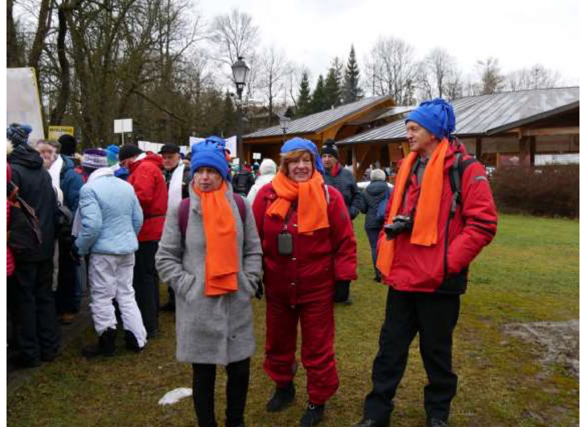
Nasze medalistki i zespół organizatorów