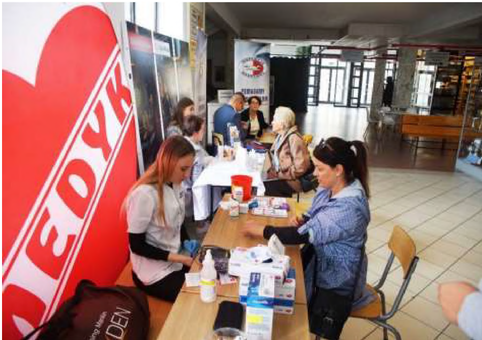
Prelekcje porady i badania