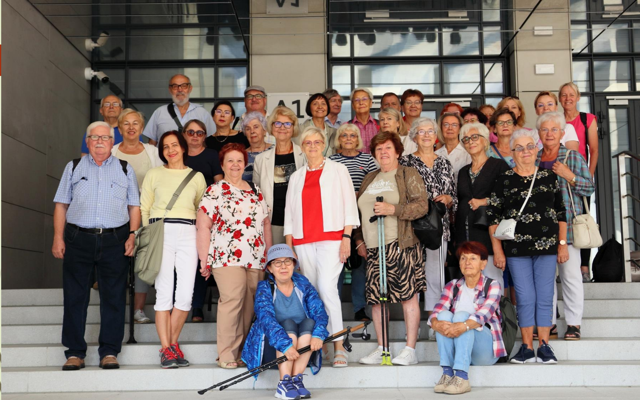
Zwiedzanie Podkarpackiego Centrum Nauki „Łukasiewicz”