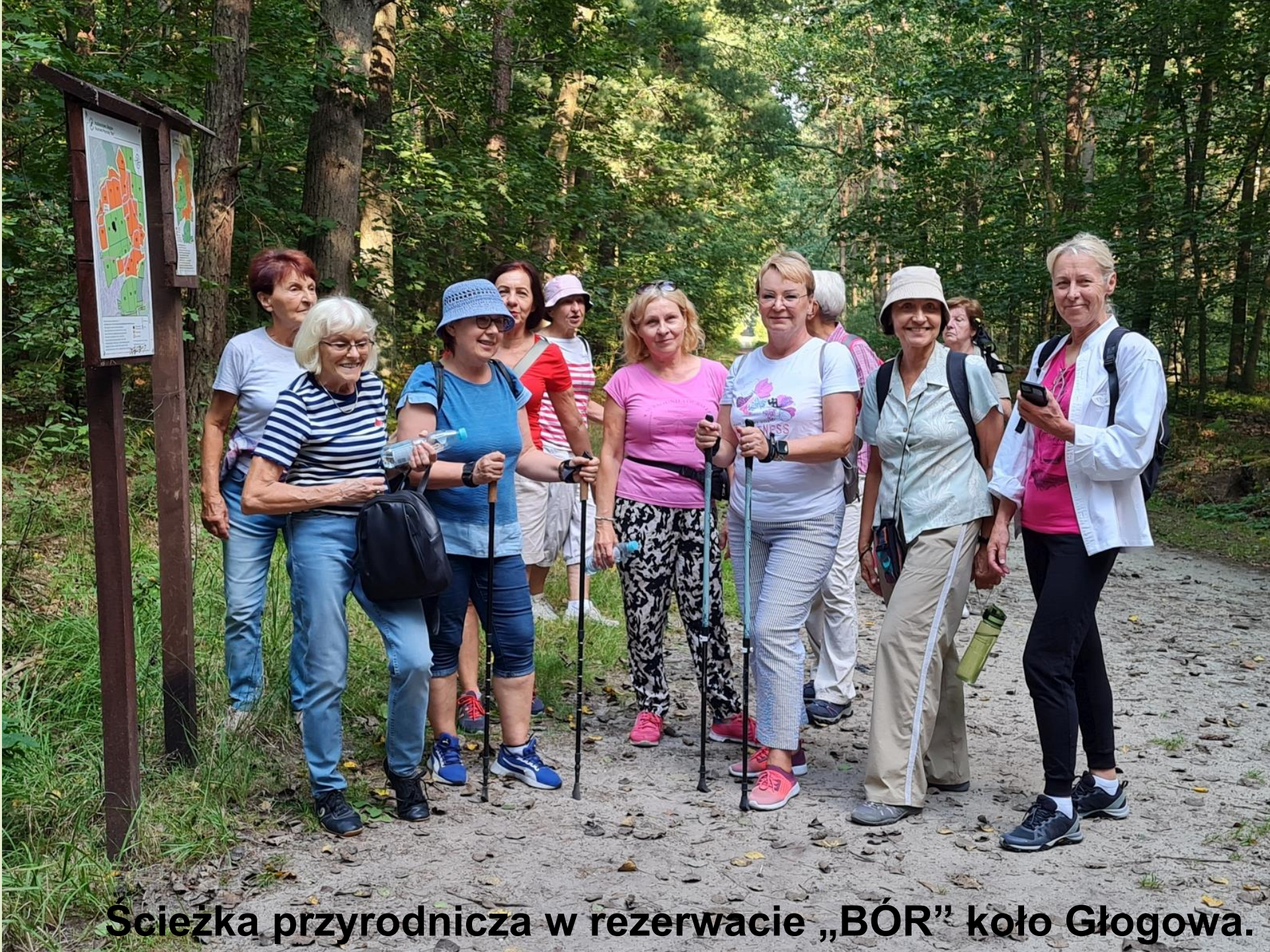
Ścieżka przyrodnicza w rezerwacie „BÓR” koło Głogowa.