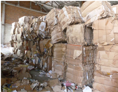
Фото 4. Паперово-збагачувальний цех

Із введенням в експлуатацію нового обладнання підприємство започаткувало виробництво «білого» газетного паперу та кольорової поліграфії.