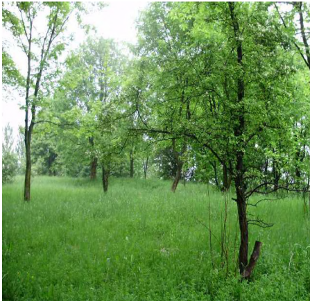
Фото 2. Рослинність старих відвалів

На нових висипах рослинність представлена в основному злаками та осоковими (фото 3). Винятком є обліпіха крушиноподібна, вона є найпоширенішим видом на нових відвалах.