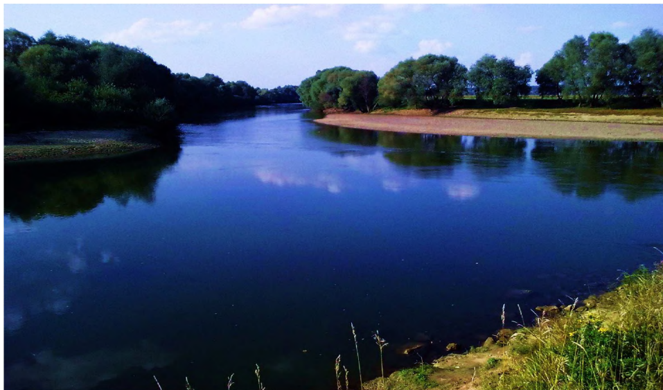
Фото 6. Місце злиття річок Стрий (зліва) та Дністер (справа) на захід від міста Ходорова [31]

Тече спершу на захід, далі – на північ, північний схід, схід та південний схід, у середній та нижній течії – переважно на північний схід, у пригирловій ділянці – на схід. Впадає у Дністер за 10 км на схід від Жидачева (фото 6).