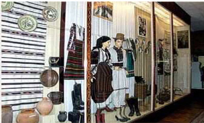
Фото. 19. Фрагмент етнографічної експозиції

Музей з 1991 р. видає науковий журнал “Літопис Борщівщини”. Вийшло з друку 10 випусків. У цьому виданні, друкуються результати наукових досліджень з історії, археології, етнографії та ін. Журнал розповсюджується у всі великі бібліотеки України та деякі за кордоном.