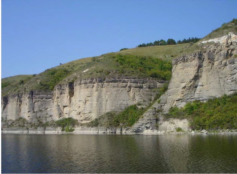
Фото 12. Комплекс осадових гірських порід на березі річки Дністер

Різноманітність екологічних умов спричинила формування у межах Дністровського каньйону багатой флори вищих судинних рослин, яких налічується тут понад 1100 видів з яких понад 100 представлено ендемічними і реліктовими видами, 21 – внесених до Червоної книги України, 2 – до Європейського Червоного списку, 43 – Переліку рідкісних і таких, що перебувають під загрозою зникнення на території Тернопільської області [7].