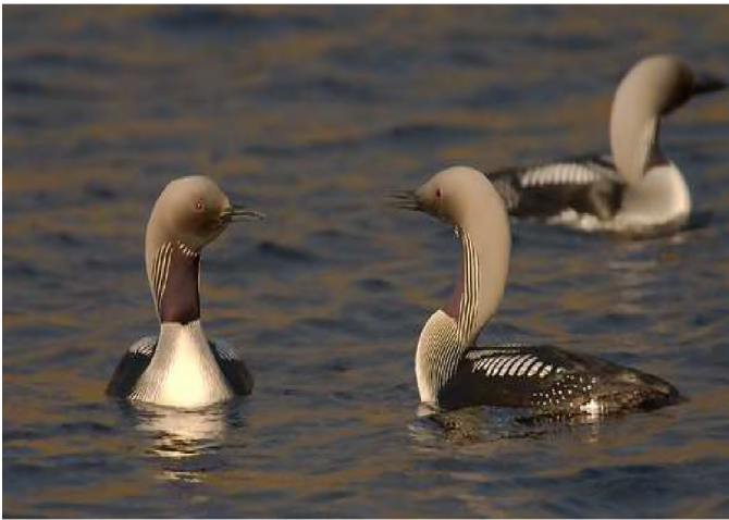
Фото 15. Червонокнижний вид Гагара чорношия [23] або гагара чорновола ( Gavia arctica )

Тут можна побачити рідкісних водоплавних, які прилітають перезимовувати з Півночі: чорношию гагару (фото 15), гоголя, великого і малого крехів, турпана (фото 16), морську чернь, морянку та інші цікаві види.