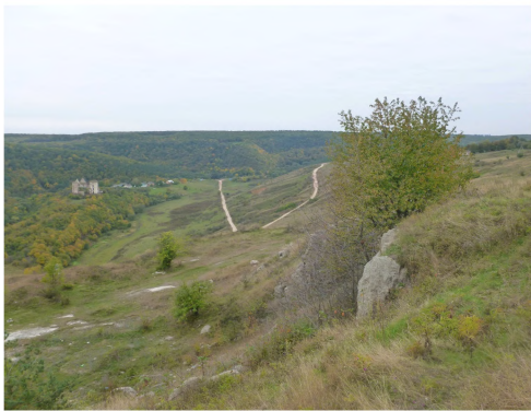
Фото 9. Панорама урочища Червоне. Вдалині Червоногородський замок-фортеця

відпочинку є чимало пам'яток природи, які приваблюють туристів: водоспади, печери, химерні скелі [19].