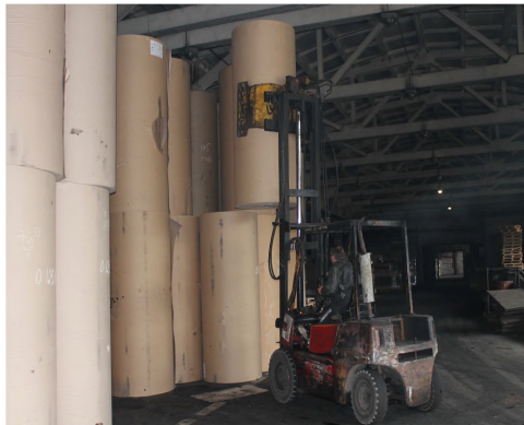
Фото 5. Склад готової продукції

Крім того, з упровадженням технології розмелювання та відбілювання відходів розв'язалися й екологічні питання, тому що зменшили кількість відходів, а найголовніше, почав використовуватися найбільш “чистий” і передовий із погляду екології метод відбілювання – пероксидний, який не завдає шкоди навколишньому середовищу. Це той рідкісний випадок, коли економічні й екологічні проблеми виробництва розв’язалися паралельно.