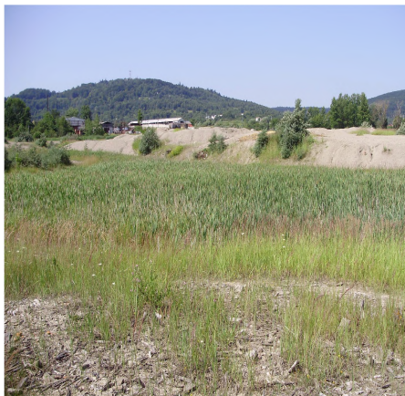
Фото 3. Рослинність нових відвалів