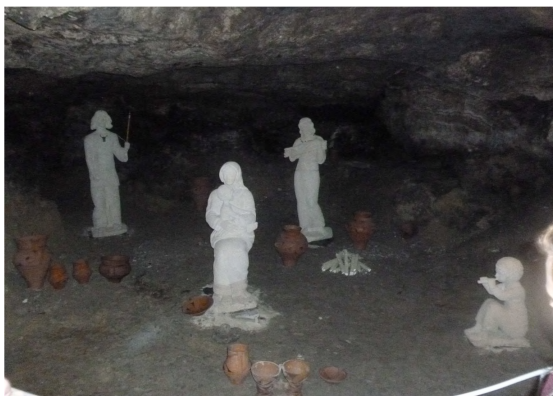
Фото 13. Фрагмент трипільського побуту

Серед пам'яток трипільської культури печері Вертеба належить унікальне місце (фото 13). З предметів, знайдених у печері, була складена одна з найбільших археологічних колекцій, відомих сьогодні науці. З огляду на унікальність природного об'єкта, у жовтні 2004 року у “Вертебі” створено перший в Україні підземний музей трипільської культури (фото 13) у природному підземному середовищі [29].