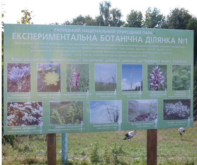
Фото 10. Памятка про Червонокнижні види рослин у Галицькому національному природному парку

Галицький національний природний парк створений (реорганізований з ландшафтного регіонального парку) у 2004 році. Його площа охоплює 14684,8 га, з них у постійному користуванні парку знаходиться 12159,3 га. Діяльність парку спрямована на збереження, відтворення і раціональне використання типових та унікальних лісових і лісостепових природних комплексів Прикарпаття [16] (фото 10).