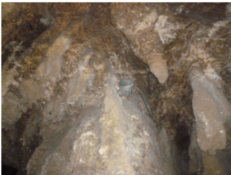
Фото 14. Печера “Кришталева”

Кришталева печера розміщена неподалік с. Кривче Борщівського району. Довжина досліджених ходів складає близько 22 км, а розроблений туристичний маршрут – 2,8 км. За незвичну красу, Кришталеву печеру, називають підземною перлиною Поділля (фото 14). Впродовж року стала температура (+10,6 °С) [4, 29 ]. Перші згадки про печеру натрапляємо в 1721 р., заново відкрита вона була в 1908 р.. На стінах печери можна побачити різноманітні кристали гіпсу, багато з яких нагадують обриси тварин [12].