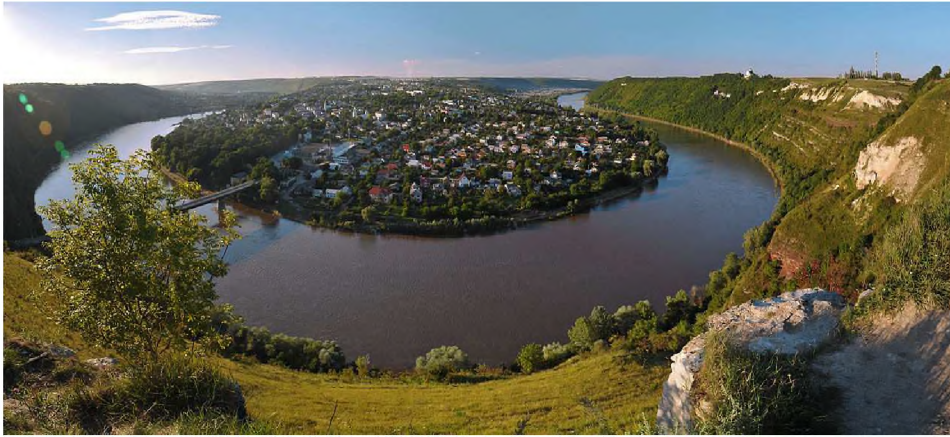
Фото 11. Панорама Національного природного парку “Дністровський каньйон” [34]

Територією Тернопільщини протікає одна з найкрасивіших у Європі і друга за величиною в Україні – річка Дністер (фото 11).