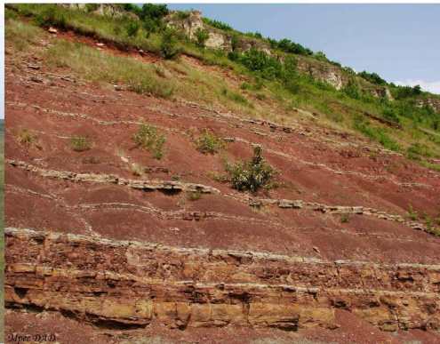
Фото 8. Відслонення породи девонського періоду