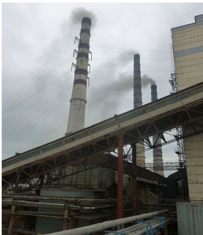
Фото 17. Панорама викиду оксиду вуглецю у повітря

У 2009 р. зафіксовано викиди 190,9 тис. тонн шкідливих речовин – це конкретно 20,5 тис. т твердих частинок, 9,4 тис. діоксиду нітрогену, 0,93 тис. т діоксиду карбону, 159,9 тис. сірчистого ангідриду (фото 17).