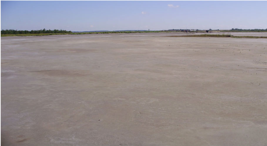
Фото. 1. Панорама Стебницького хвостосховища

Хвостосховища, які виникли у результаті роботи Стебницького державного гірничо-хімічного підприємства “Полімінерал”, є типовою формою техногенного ландшафту. Ці землі не є придатними для сільськогосподарського використання чи під забудову, а оптимізація техногенних екотопів відбувається тільки шляхом самозаростання [15].