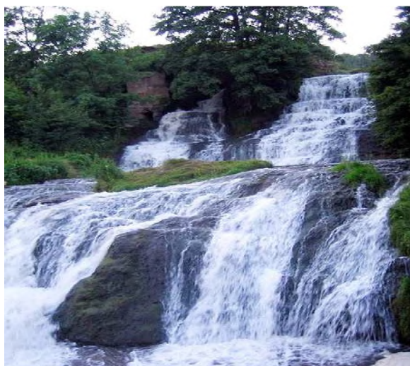
Фото 7. Джуринський водоспад

Недалеко від Дністра розмістився один із найбільших та найкрасивіших водоспадів України – Джуринський (Червоногородський) (фото 7), де ріка Джурин з оглушливим ревом скидає свої води з висоти 16 метрів, розсипаючи їх вологим казковим маревом. Хмари найдрібніших краплинок води здіймаються над вирвою, їх підхоплює повітряний потік і лагідним дощиком зрошує прилеглу місцевість [1].