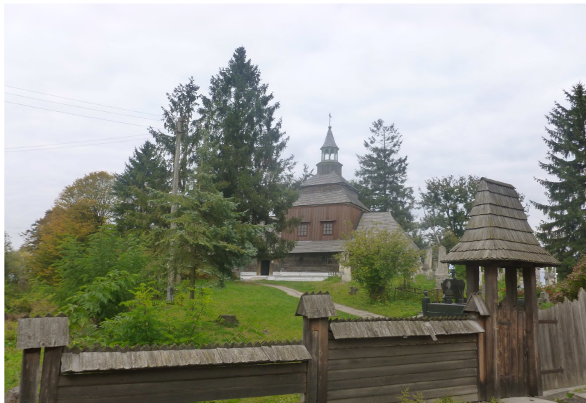
Фото 18. Панорама церкви Святого Духа

1650 р. та є одним з трьох найстаріших, збережених до нашого часу, іконостасів України. В експозиції церкви-музею представлені унікальні твори іконопису. Зокрема, одна з найдавніших збережених в Україні ікон – “Іоанн Хреститель з житієм” (середина XVI ст.), а також ікони іконостасу кінця XVI ст. Для огляду пропонуються стародруки, дерев’яні скульптури та вироби з каменю [13].