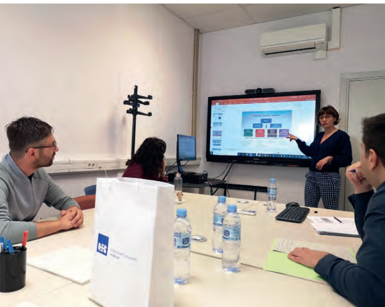
Wizyta studyjna pracowników BON w Uniwersytecie w Barcelonie

nienia typu wewnętrzny parking przeznaczony dla dziecięcych wózków (dla studentek będących matkami i muszących się udać z dziećmi np. do biblioteki). Specjalne wyciszone pokoje służące do egzaminowania osób ze spektrum autyzmu oraz wiele innych.