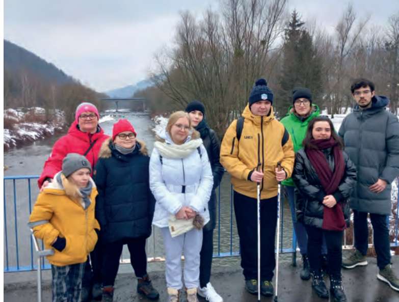
Obóz zimowy BON Ustroń 2023

Tu, oprócz podstawowych informacji dotyczących pracy Biura, znajdują się aktualne informacje o planowanych przedsięwzięciach, projektach, ważne linki oraz dane kontaktowe pracowników i współpracowników BON – konsultantów ds. osób z niepełnosprawnościami poszczególnych jednostek uczelni.