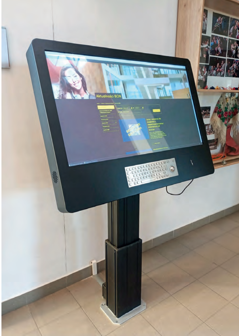
Ruchomy kiosk multimedialny z wbudowaną pętlą indukcyjną