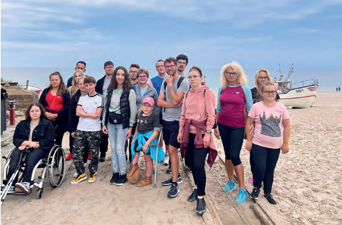
Obóz letni BON Dąbki 2023