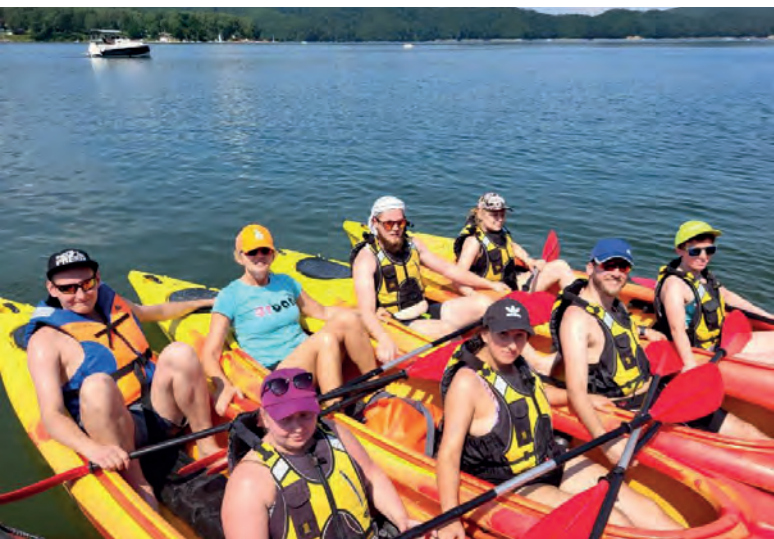
Obóz letni BON Polańczyk 2023

Bałtykiem. Tego roku nad morzem dopisała piękna pogoda, co pozwoliło na plażowanie, a nawet kąpiele w morzu. Podczas obozu studenci odbyli wycieczkę do Kołobrzegu i Darłówka. Organizowane były wycieczki rowerowe, wycieczki piesze, nordic walking, odbyły się treningi i rozegrano turniej w bule.