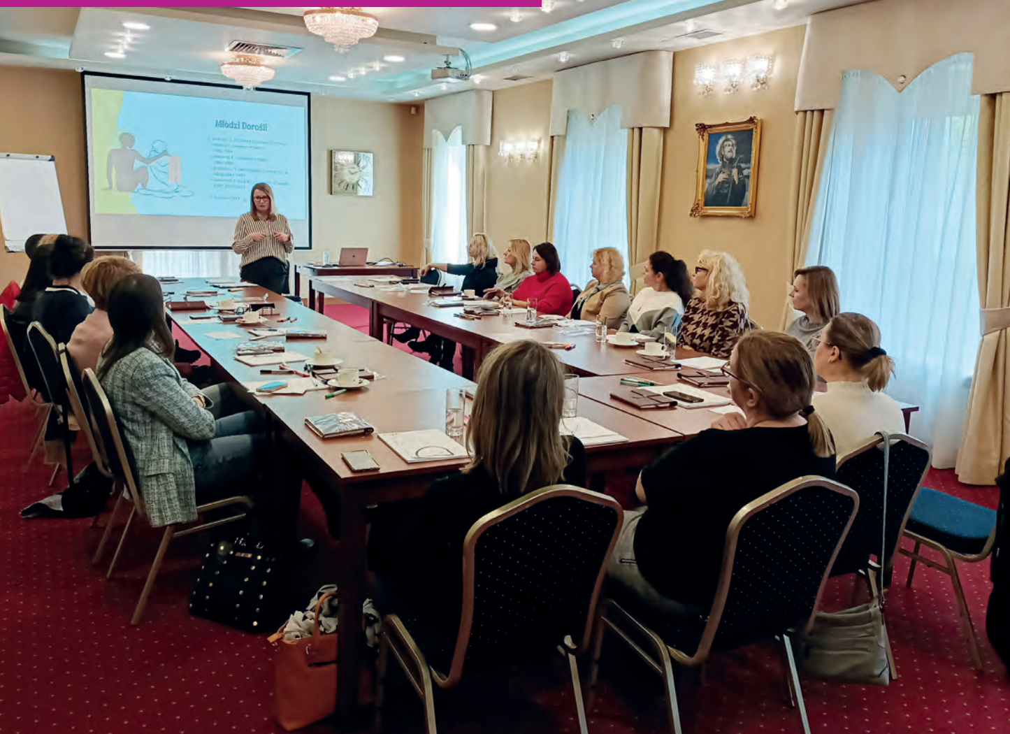
Szkolenie pracowników UR na temat wsparcia osób w kryzysie zdrowia psychicznego