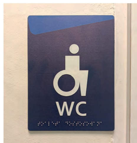
Tablice tyflograficzne w budynkach UR

tualny asystent studenta, dostępny 24/7, sterowany przez sztuczną inteligencję.