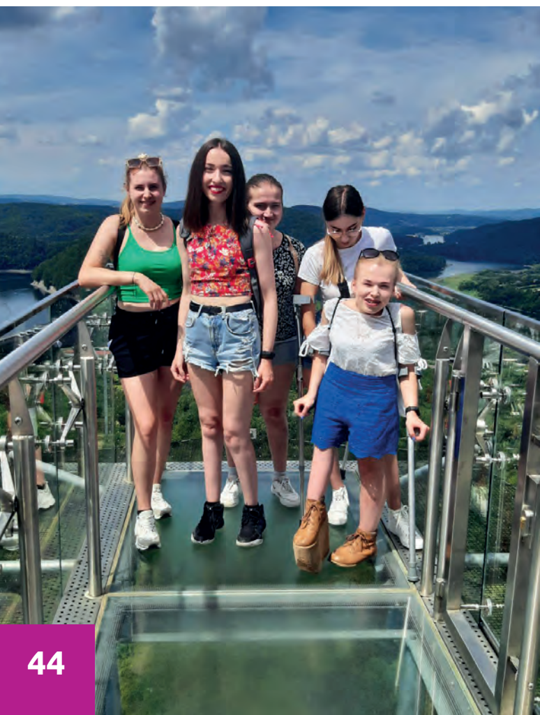
Obóz letni BON Polańczyk 2023, punkt widokowy w Solinie

spojrzenie na sferę aktywizacji zawodowej i społecznej osób z niepełnosprawnościami organizowany przez Fundację Optea i BON, Rzeszów 3.12.2022 r.