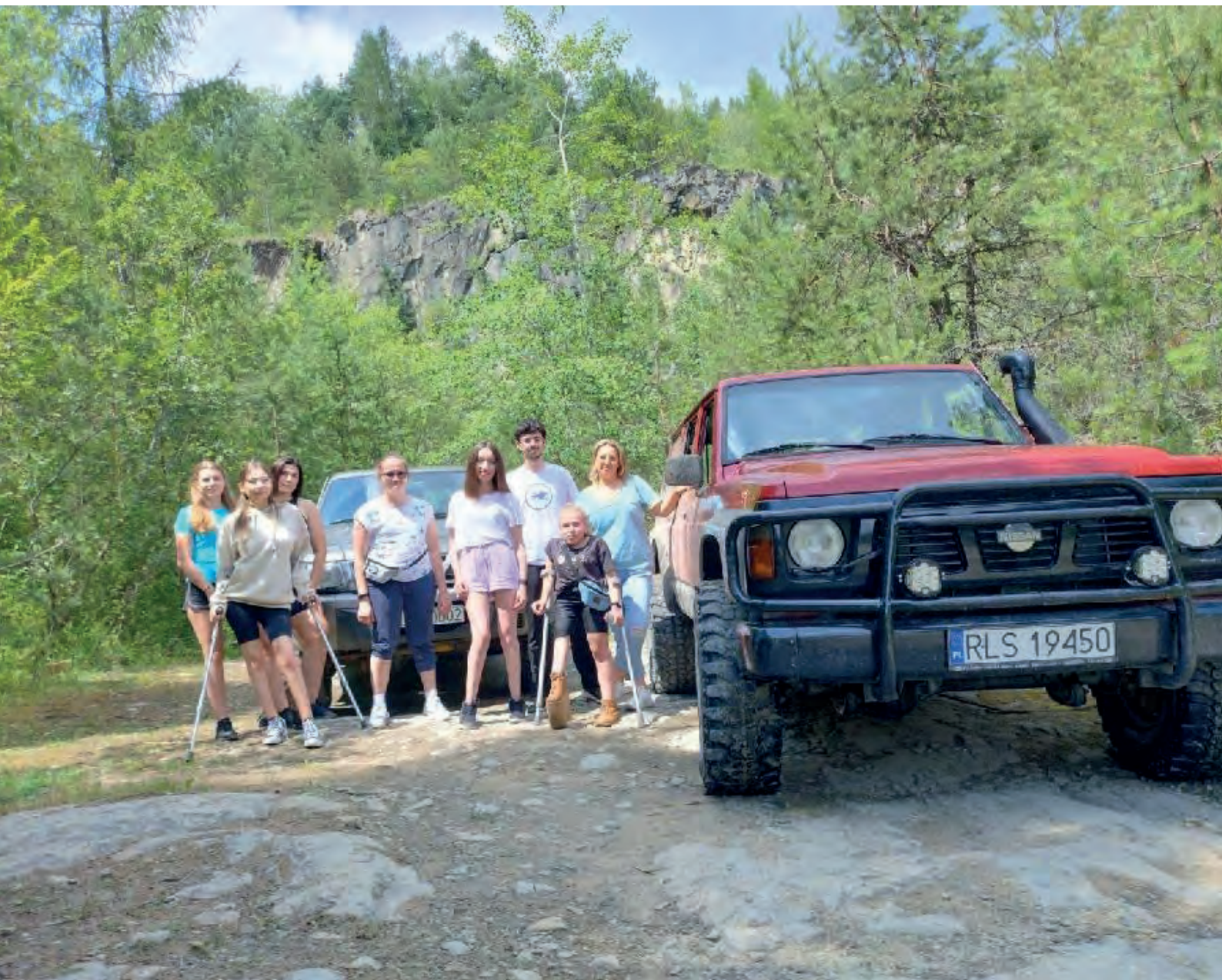
Obóz letni BON Polańczyk 2023, wyprawa offroadowa

Piątek był ostatnim pełnym dniem obozu. Na jego zakończenie odbyło się ognisko, podczas którego ogłoszono wyniki turnieju kręglarskiego. Gratulacje dla zwycięzców.