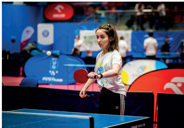
Integracyjne Mistrzostwa Polski AZS w tenisie stołowym, Gdańsk 2022

Integracyjne Mistrzostwa Polski AZS w pływaniu, Poznań 2023