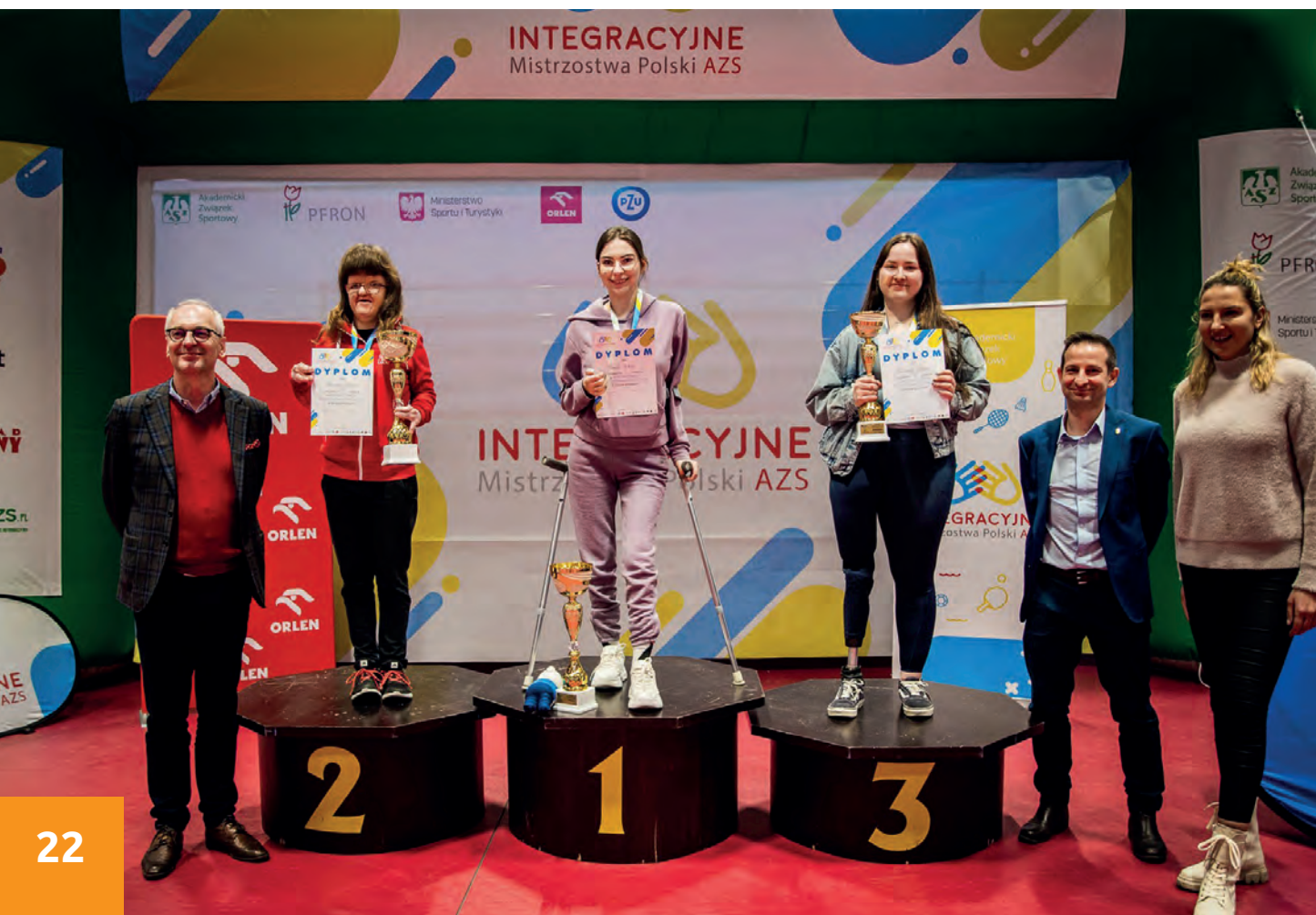
Integracyjne Mistrzostwa Polski AZS w tenisie stołowym, Gdańsk 2022

BON i KU AZS UR reprezentowało 7 studentów, którzy po raz kolejny nie zawiedli. Debiu-