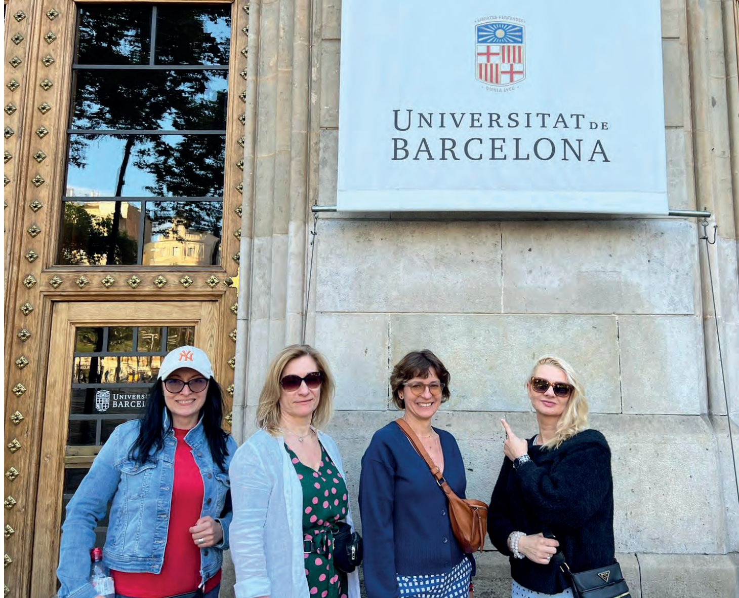
Wizyta studyjna pracowników BON w Uniwersytecie w Barcelonie

i studentami ze szczególnymi potrzebami. Początkowo beneficjentami świadczonej pomocy byli głównie studenci z niepełnosprawnościami sensorycznymi, z czasem biorcami wsparcia są również studenci z zaburzeniami psychicznymi. Chcąc przeciwdziałać dyskryminacji i wyrównywać szanse edukacyjne, jednocześnie zachęcić osoby z niepełnosprawnościami do podejmowania edukacji na poziomie wyższym, Uczelnia gwarantowała 5% miejsc dla niepełnosprawnych kandydatów na każdym prowadzonym przez UB kierunku studiów.