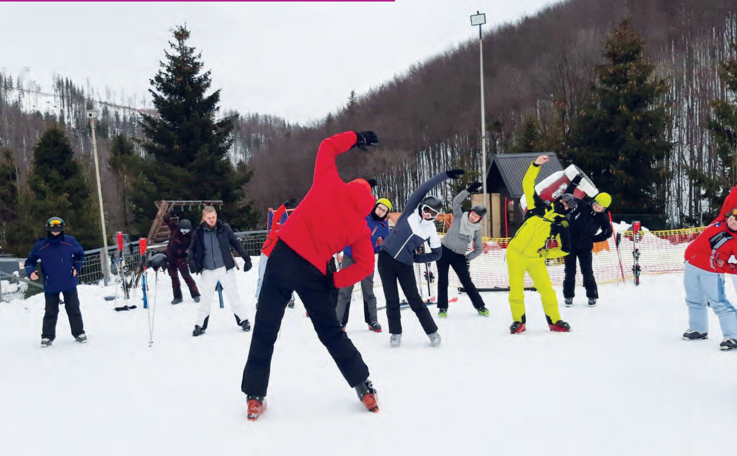
Obóz zimowy BON Ustroń 2023