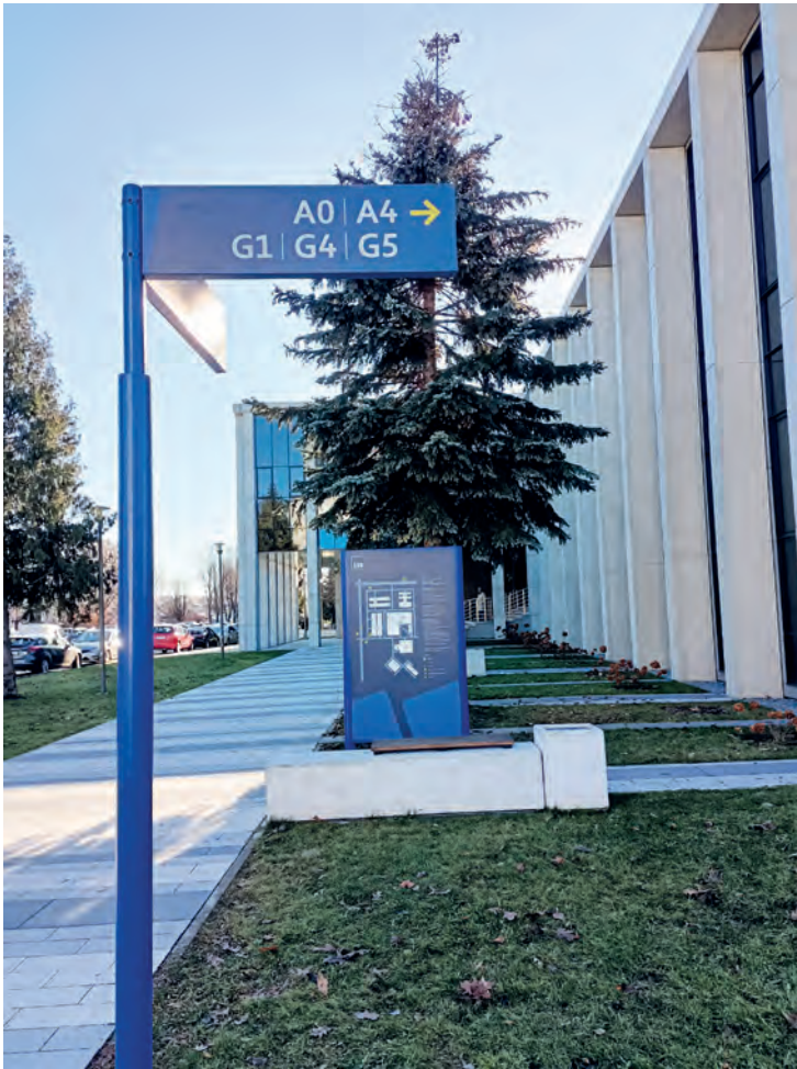
System informacji kierunkowej ułatwiający orientację przestrzenną (kierunkowskazy, mapy, totemy)