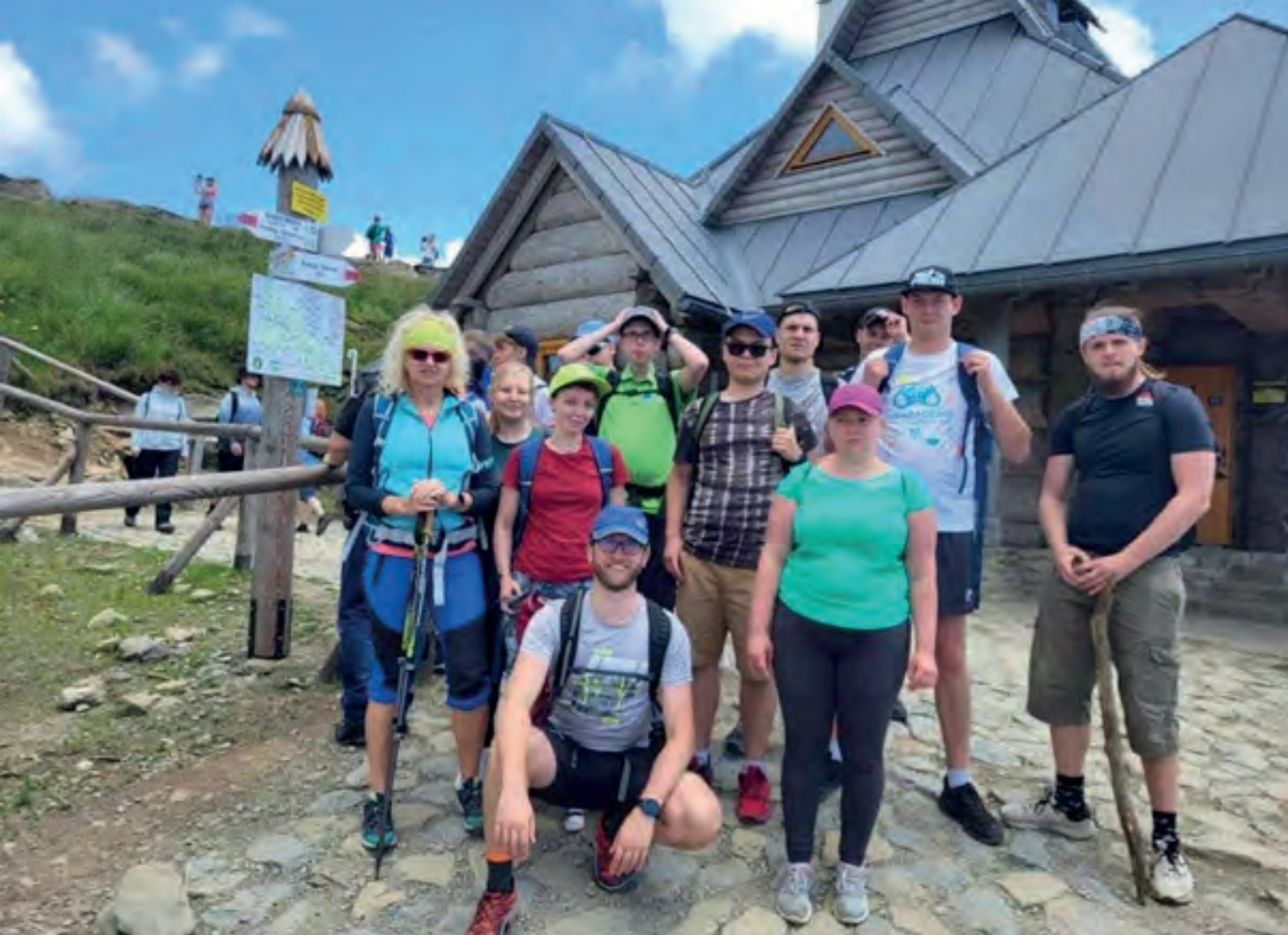
Obóz letni BON Polańczyk 2023, wycieczka na Połoninę Wetlińską