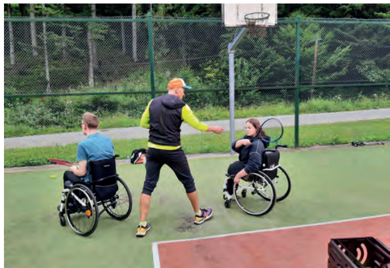
Obóz letni BON Wierchomla 2023

– Piwniczna. Ci studenci, którzy ze względów zdrowotnych nie jeżdżą na rowerze, odbyli wycieczkę do ogrodów sensorycznych w Muszynie. Nie zabrakło też innych aktywności, a były to zajęcia sportowe z tenisa ziemnego, badmintonu, pływania, frisbee, zajęcia z komunikacji interpersonalnej. Rozegrany został też turniej w tenisie stołowym.