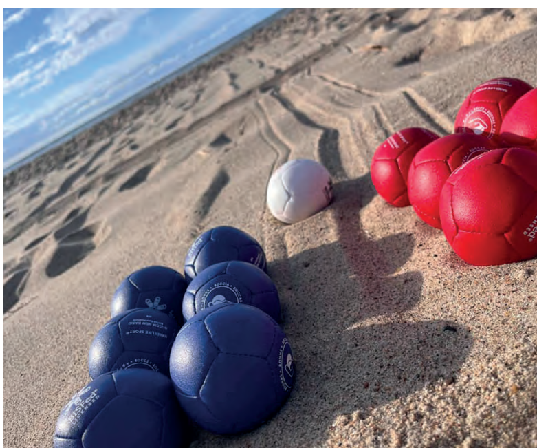
Obóz letni BON Dąbki 2023