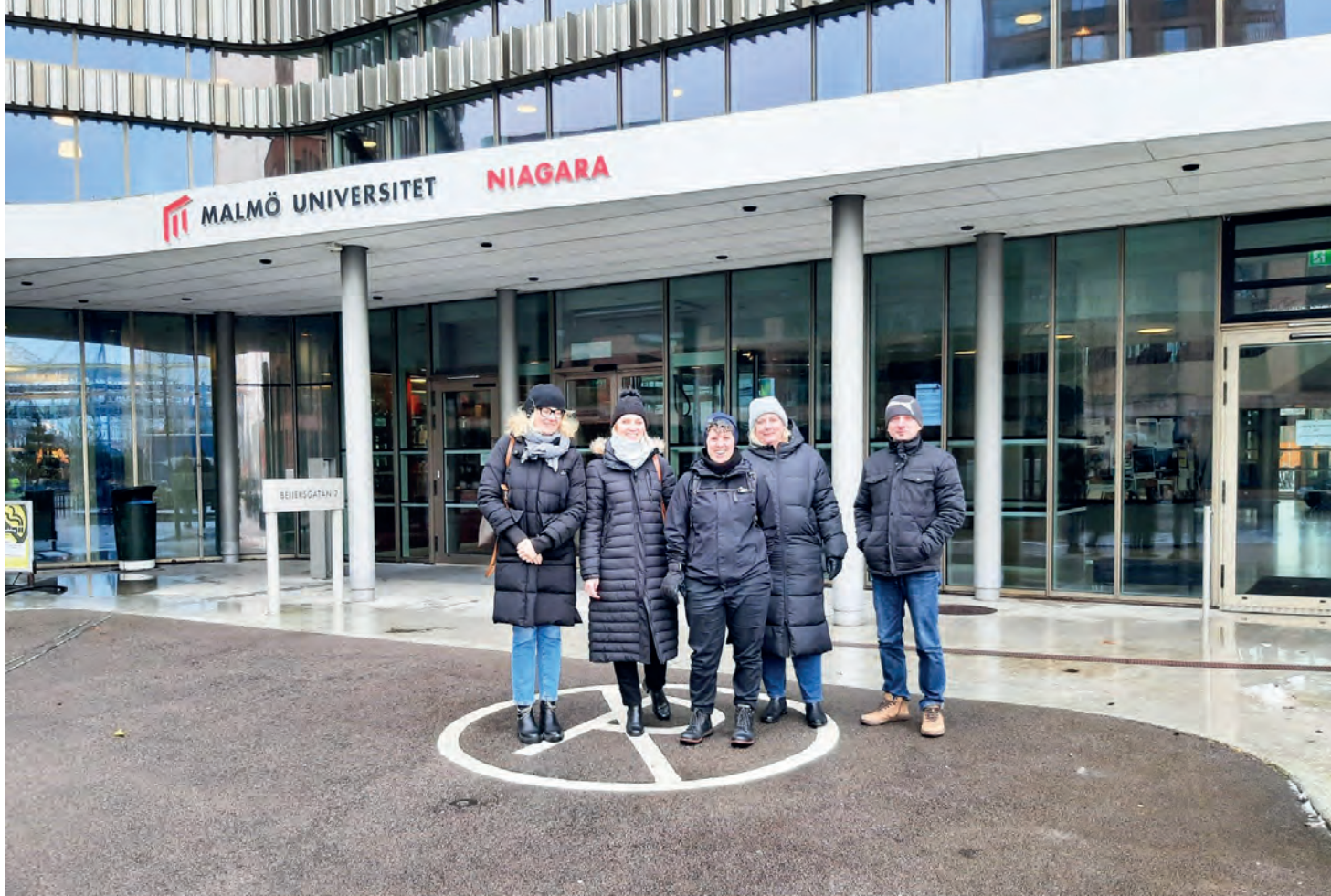
Wizyta studyjna pracowników BON w Uniwersytecie w Malmö