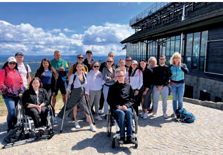
Obóz letni BON Wierchomla 2023, wycieczka na Jaworzynę Krynicką

Drugi obóz sportowy odbył się w dniach 6–12 sierpnia 2023 r. w Wierchomli niedaleko Piwnicznej w Beskidzie Sądeckim. Podczas obozu studenci odbyli wycieczki piesze do górskiego schroniska turystycznego PTTK Bacówka nad Wierchomlą, wycieczkę do Krynicy-Zdroju połączoną z wizytą w pijalni wód mineralnych i wyjazdem na Jaworzynę Krynicką.