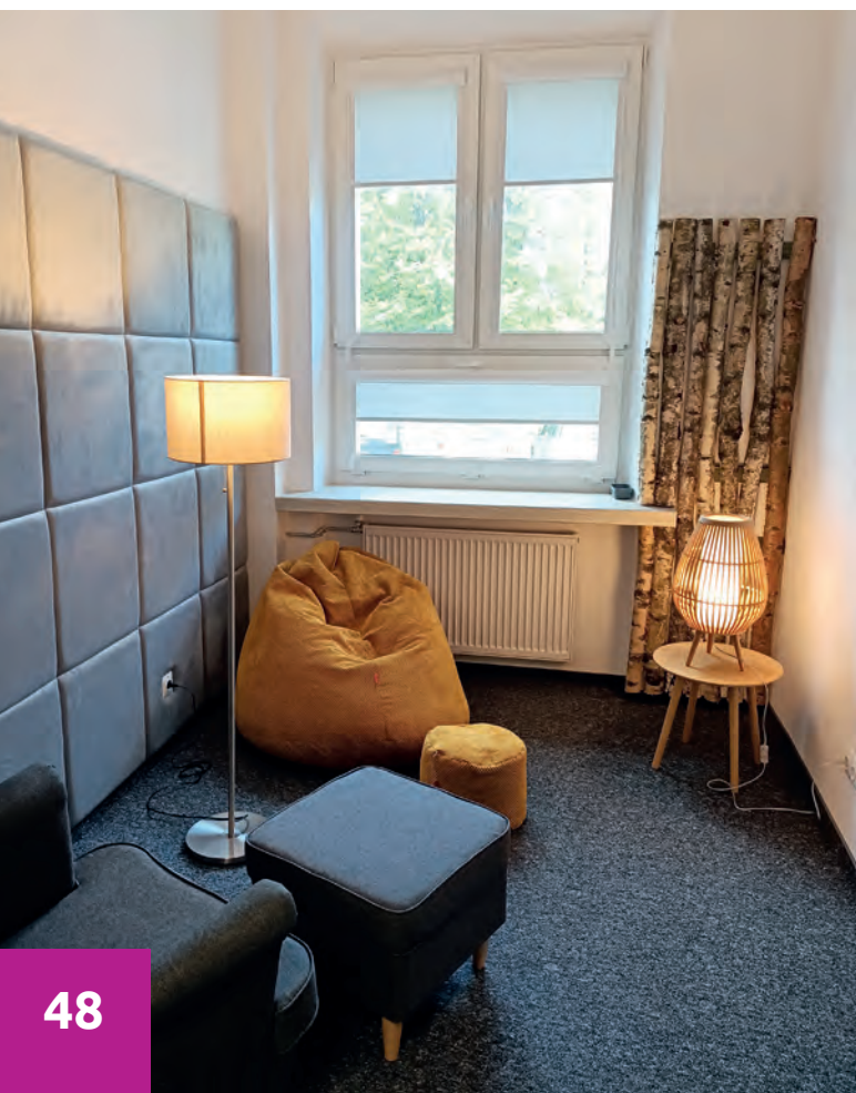
Pokój wyciszeń (miejsce odpoczynku)

W przedsięwzięciu, które rozpoczęto w 2020 r., zrealizowano szereg działań poprawiających warunki studiowania osób z niepełnosprawnościami. Najwięcej środków wydatkowano na dostępność architektoniczną i cyfrową uczelni. W ramach tego zadania wykonano m.in. windy, innowacyjne beacons – systemy naprowadzające z dedykowaną aplikacją, których zadaniem jest nawigacja użytkownika w budynkach Uniwersytetu. W 23 gmachach uczelni oraz ich otoczeniu zamontowano mapy i plany tyflograficzne, znaczniki i kierunkowskazy oraz kioski multimedialne ze specjalistycznym oprogramowaniem dostosowane do potrzeb osób z różnymi rodzajami niepełnosprawności. Ponadto zaktualizowano do obowiązujących standardów WCAG 2.1.AA serwisy internetowe uczelni, a w Biurze Karier UR pojawił się zaawansowany system konwersacyjny – wir-