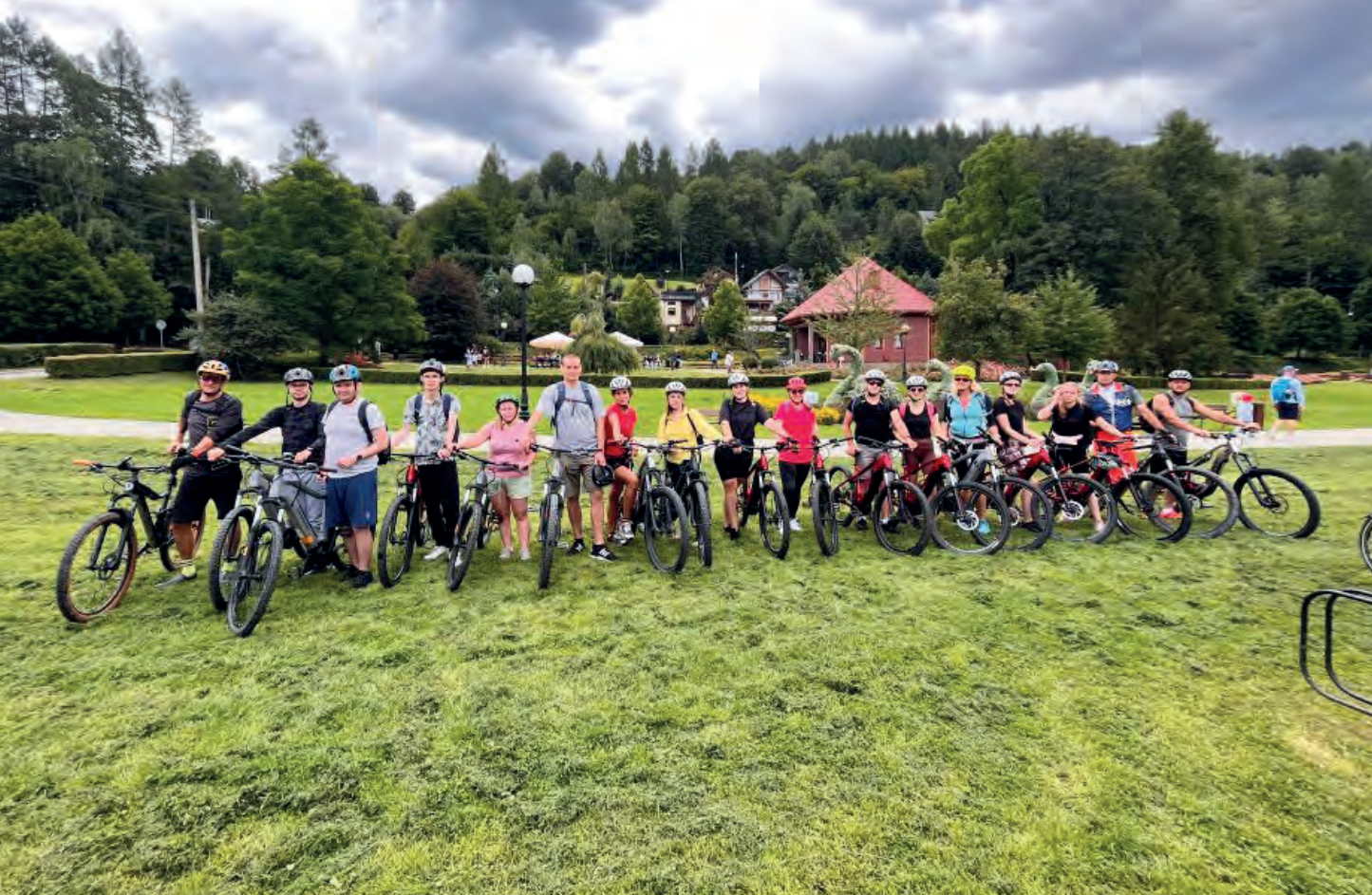
Obóz letni BON Wierchomla 2023, wycieczka na rowerach elektrycznych