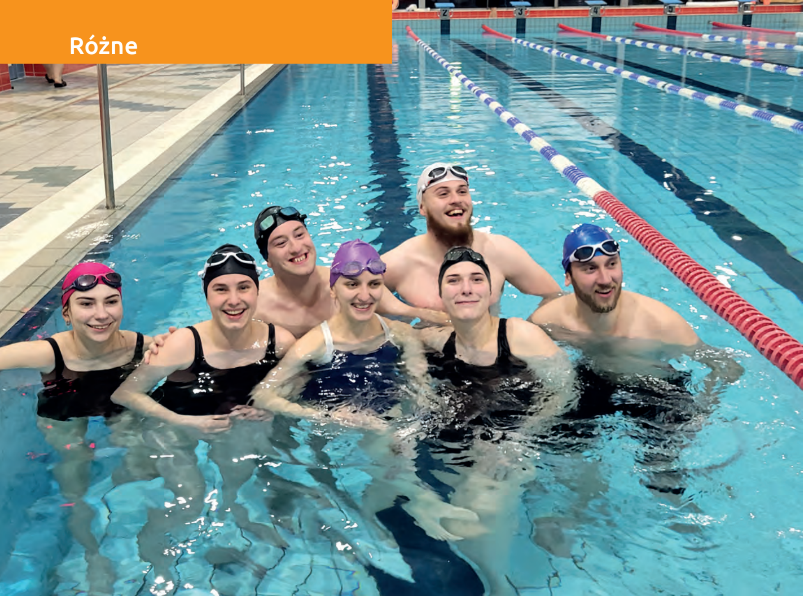
Integracyjne Mistrzostwa Polski AZS w pływaniu, Poznań 2023