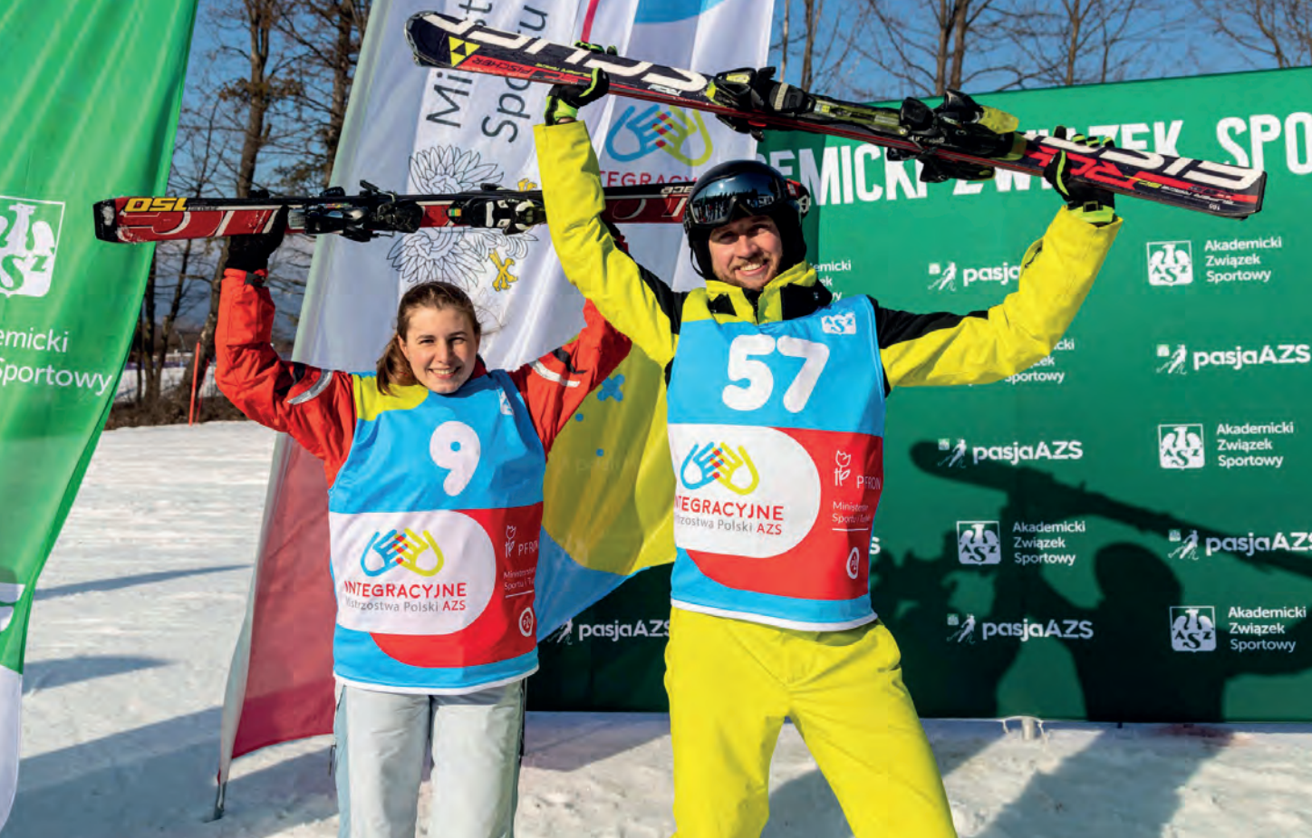
Integracyjne Mistrzostwa Polski AZS w narciarstwie alpejskim i snowboardzie, Poronin 2023