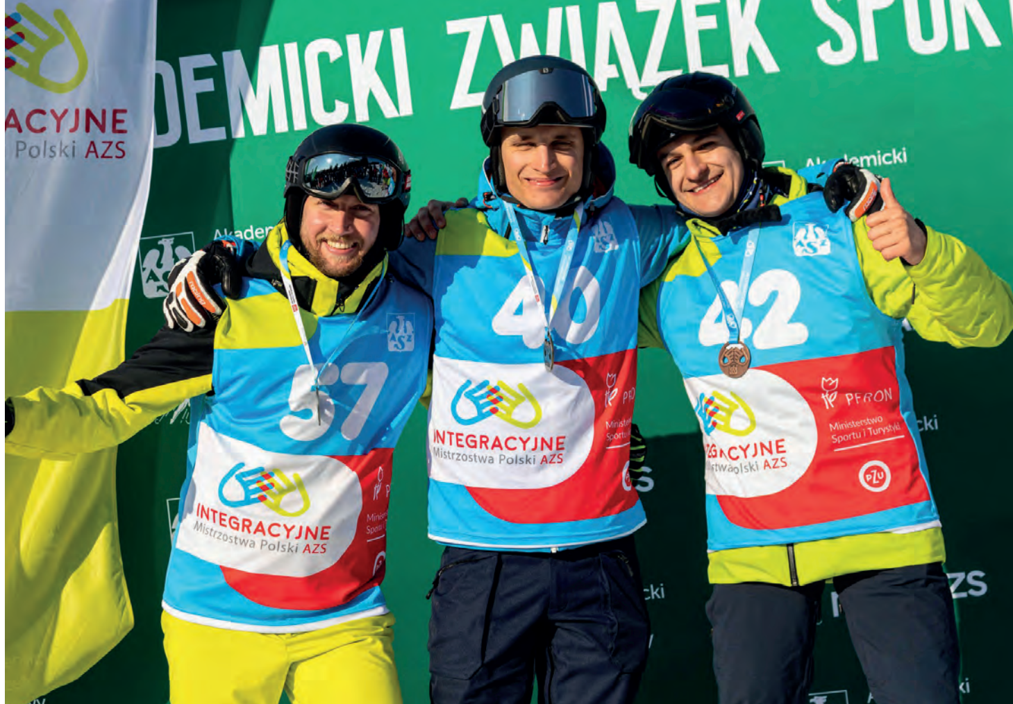
Integracyjne Mistrzostwa Polski AZS w narciarstwie alpejskim i snowboardzie, Poronin 2023