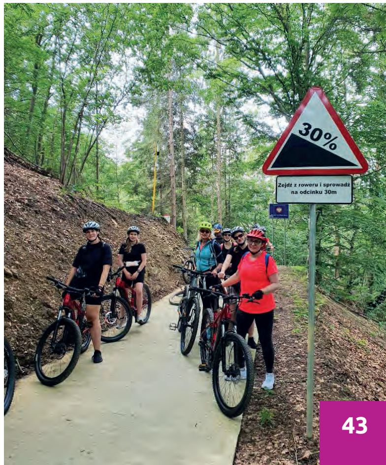
Obóz letni BON Wierchomla 2023, wycieczka na rowerach elektrycznych