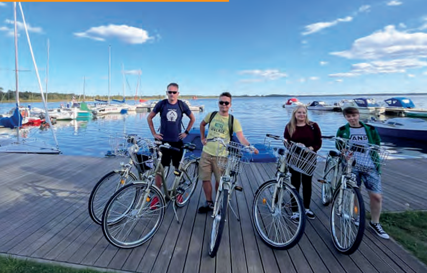
Obóz letni BON Dąbki 2023

Wszystkie dyscypliny sportu, których studenci uczą się i doskonalą podczas tego typu obozów, przekładają się na udział i zdobywane medale w Integracyjnych Mistrzostwach Polski AZS.