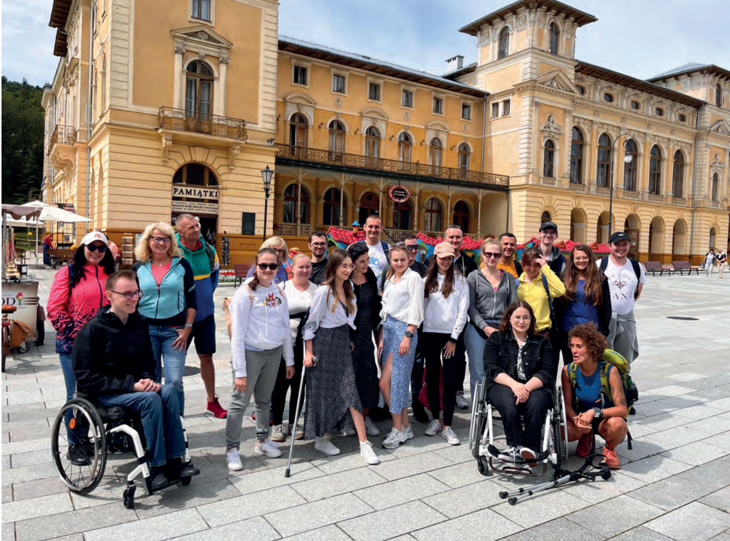
Obóz letni BON Wierchomla 2023, wycieczka do Krynicy