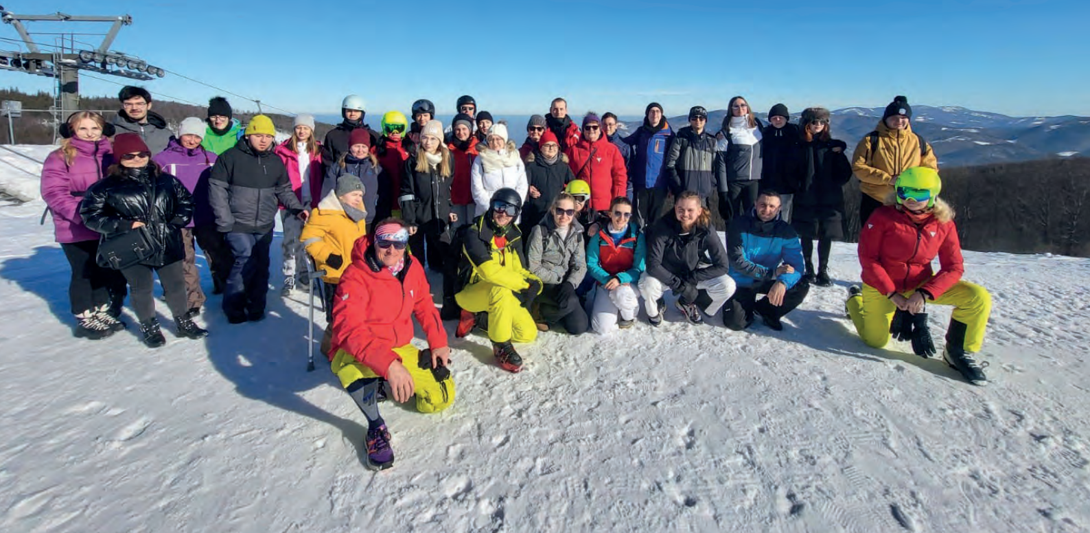
Obóz zimowy BON Ustroń 2023