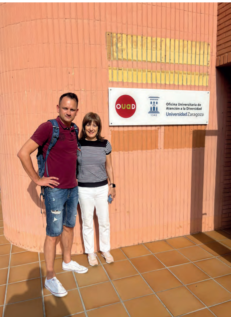
Wizyta studyjna pracowników BON w Uniwersytecie w Saragossie

na dyskryminację na przykład ze względu na płeć, tożsamość, orientację płciową czy narodowość.