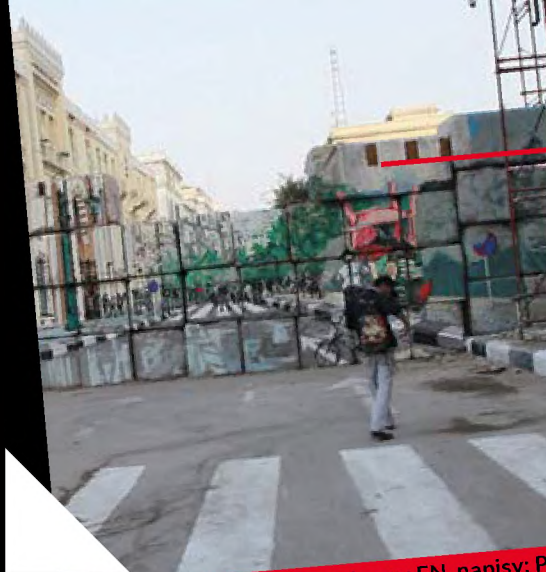
wersja językowa: EN, napisy: PL