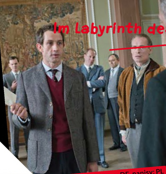
wersja językowa: DE, napisy: PL