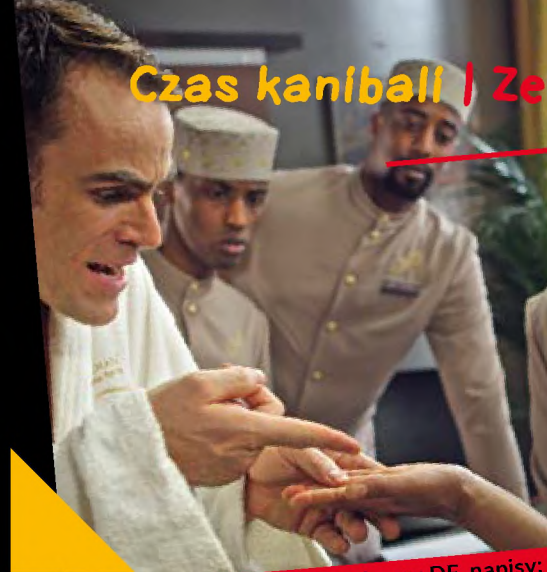
wersja językowa: DE, napisy: PL

Marco Wilms urodził się w 1966r. w Berlinie Wschodnim. Pracował jako narzędziowiec, grafi i model. W roku 1990 rozpoczął studia scenograficzne w Wyższej Szkole Artystycznej w Berlinie-Weissensee, a następnie na pozdamskim Uniwersytecie Filmu i Telewizji im. Konrada Wolfa. Jako stypendysta DAAD kształcił się w Actors Studio w Nowym Jorku, studiował także w Tajlandii. Jego najważniejsze filmy dokumentalne to: Der Fluss des Herzens (2000), Massgeschneiderte Träume (2006) i Ein Traum in Erdbeerfolie (2009).