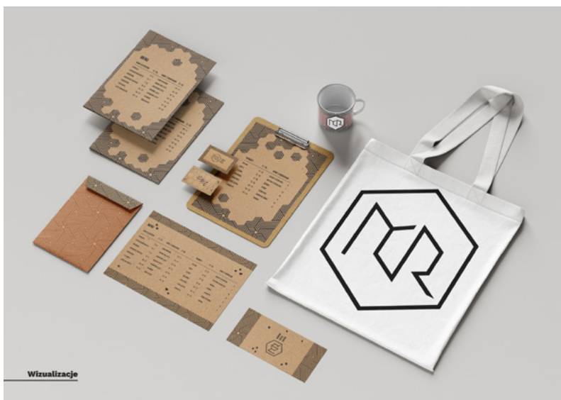
Wyróżnienie – Martyna Niziołek „Identyfikacja marki – kawiarnia Morning Coffee Routine” – fragment dyplomu

multimedia, animacja i film wideo, nominowane są przez promotorów pracowni dyplomujących na kierunku grafika i sztuki wizualne. Powołana z grona pracowników naukowo-dydaktycznych Kapituła Nagrody poddaje ocenie wszystkie prace dyplomowe i w tajnym głosowaniu wyłania laureata Nagrody Głównej oraz przyznaje wyróżnienia.