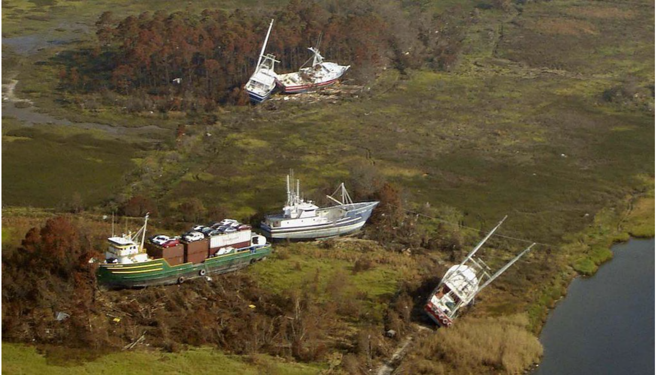
Zniszczenia w Bayou La Batre, Alabama – statki wyrzucone na brzeg