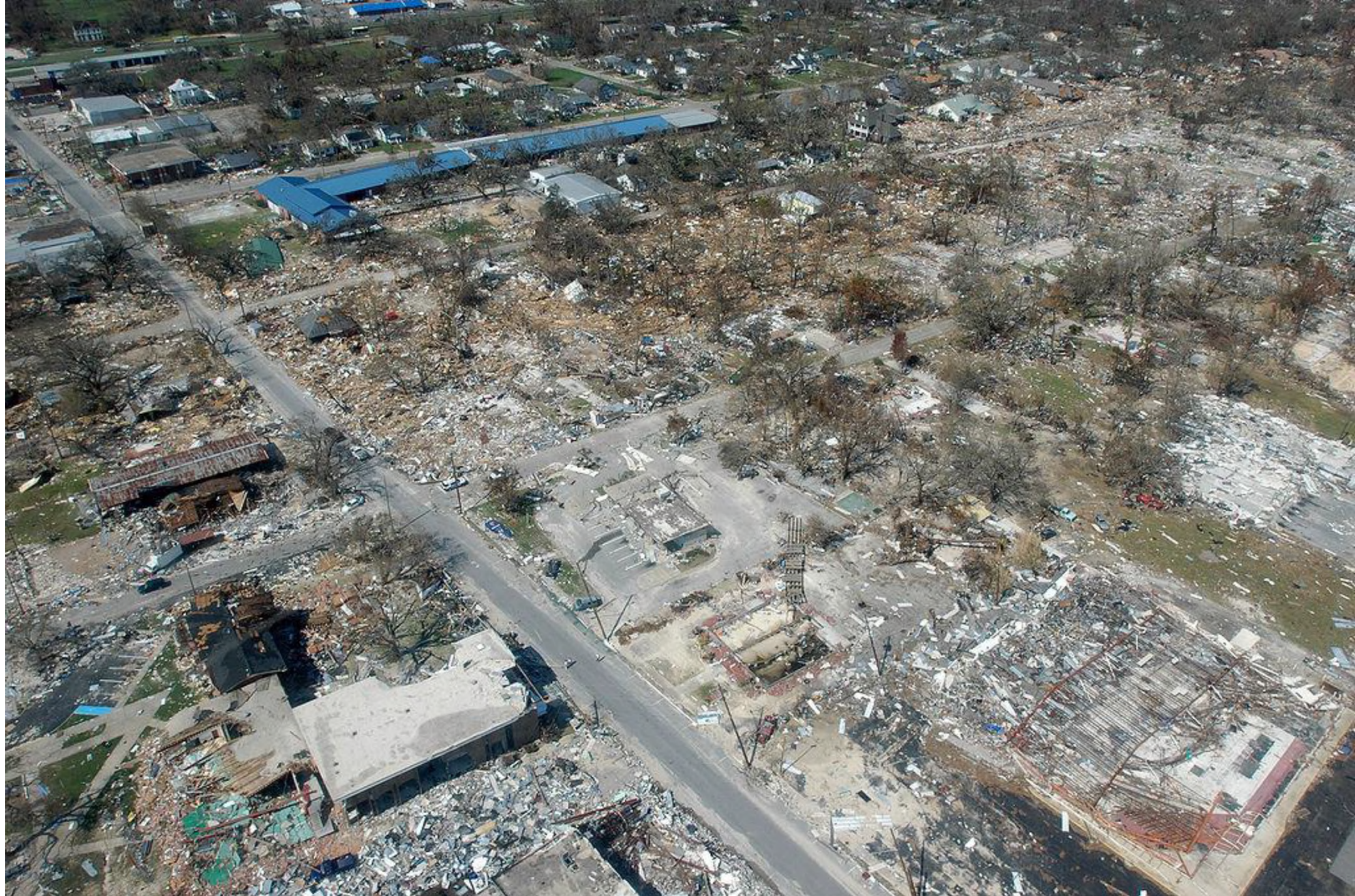
File:Hurricane katrina damage gulfport mississippi.jpg

Zniszczenia w Long Beach po przejściu cyklonu Katrina