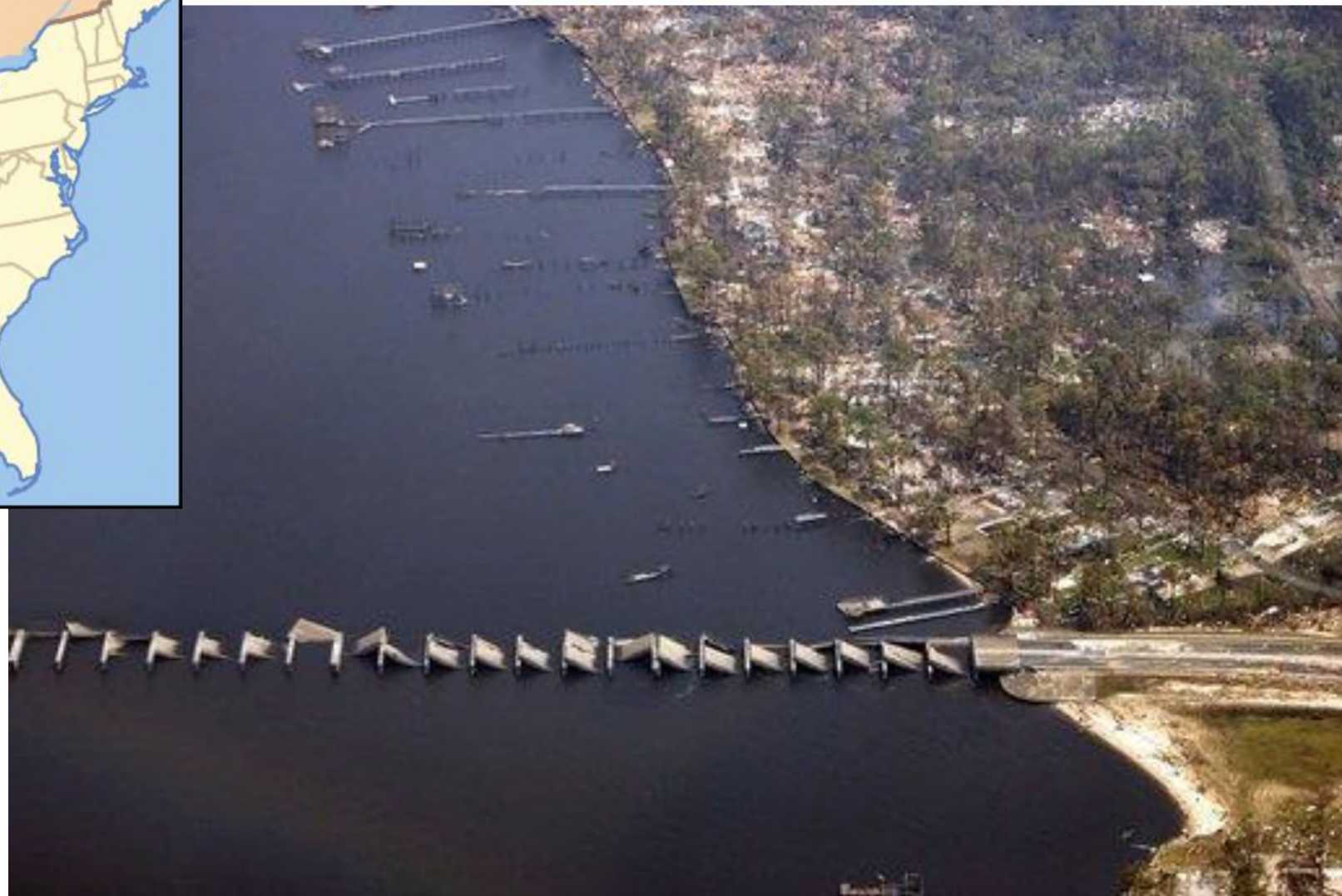
Zniszczenia na drodze stanowej nr 90 w Missisipi po przejściu cyklonu Katrina.