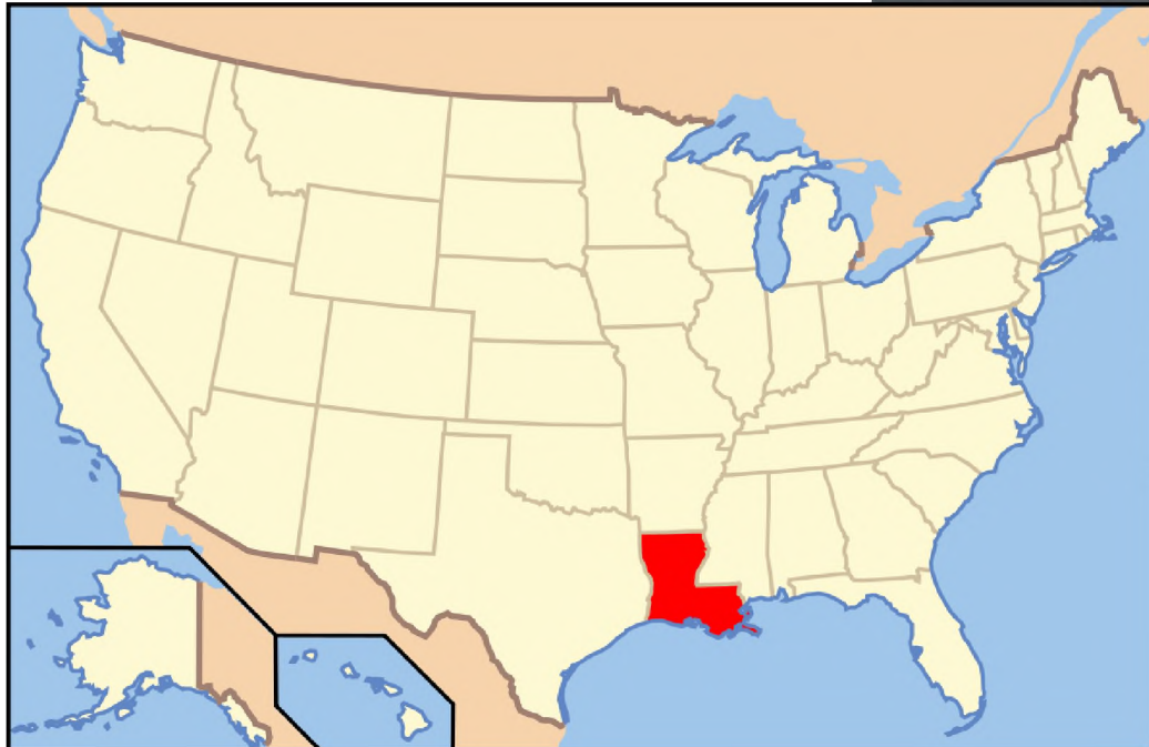
Mapka USA ze stanem Luizjana