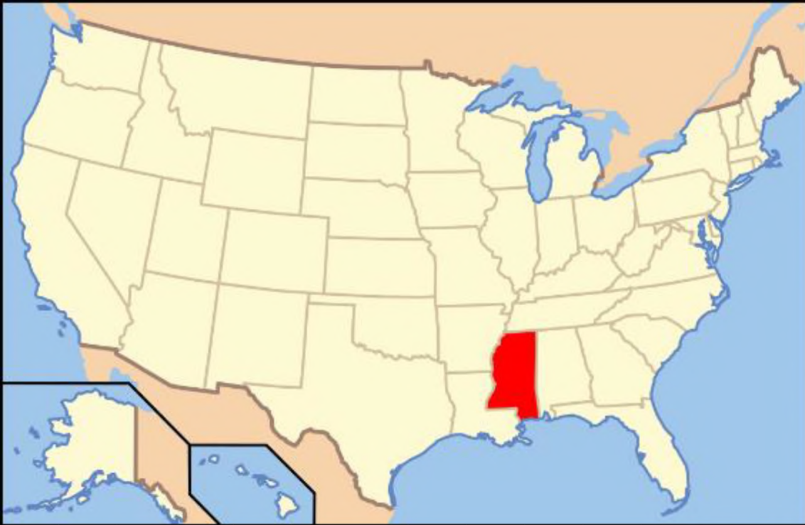
Mapka USA ze stanem Missisipi