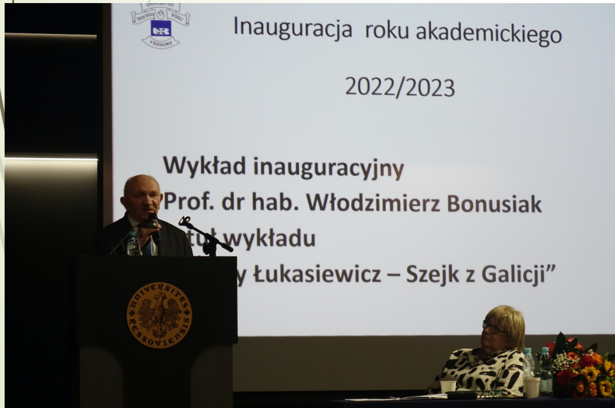
Fot. Janusz Obarski