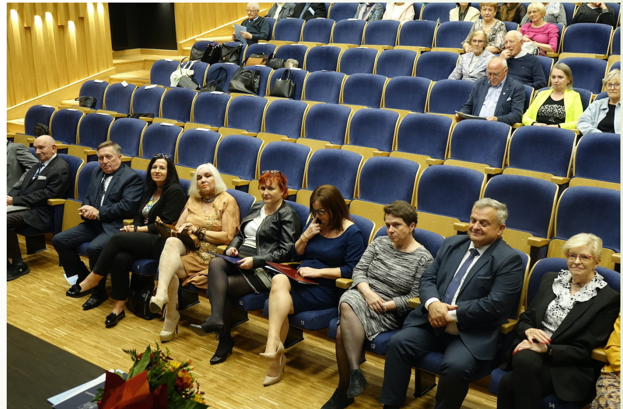
Fot. Janusz Obarski