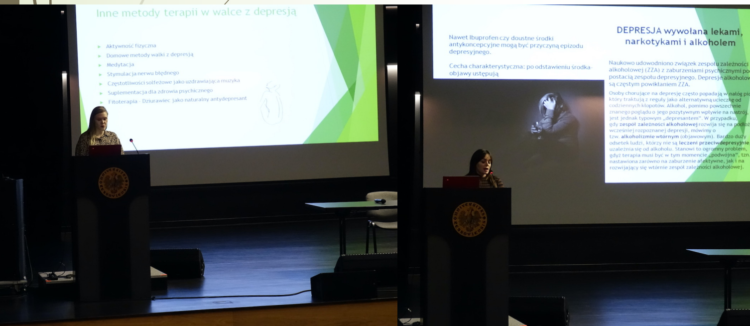
Fot. Janusz Obarski