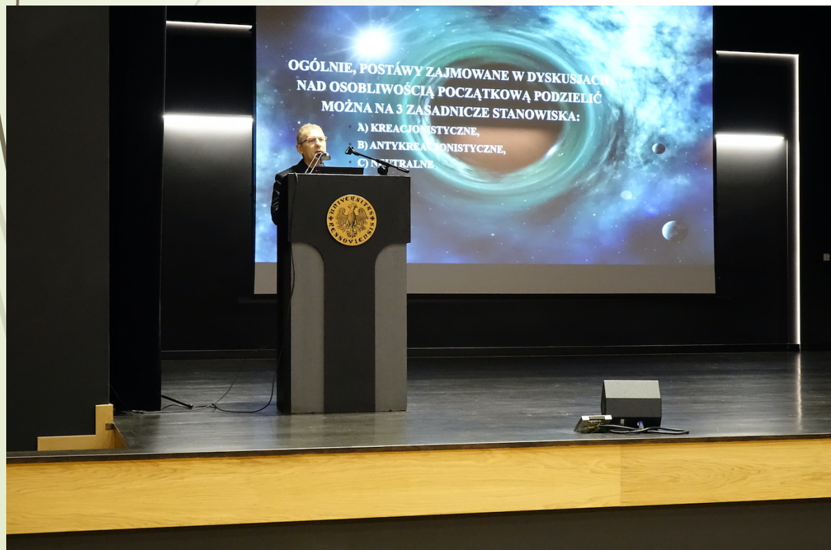
Fot. Janusz Obarski