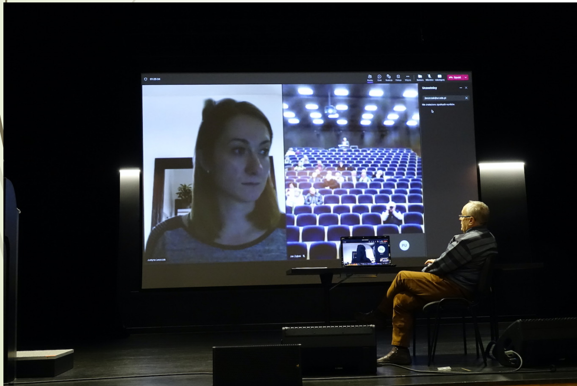
Fot. Janusz Obariski