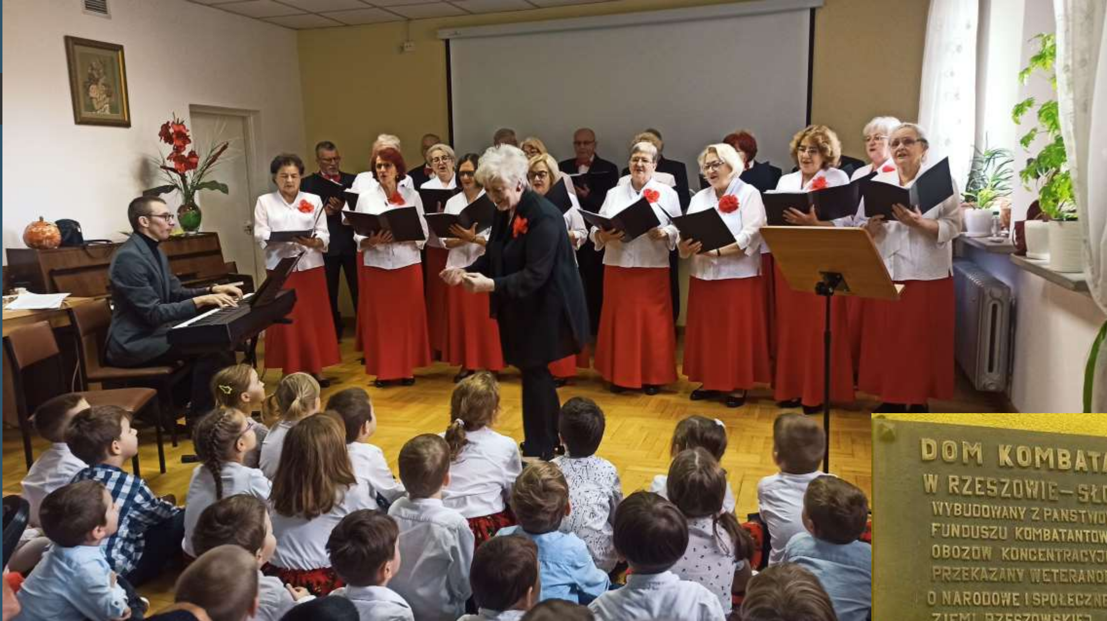
Występ chóru „Cantilena” w Domu Kombatanta