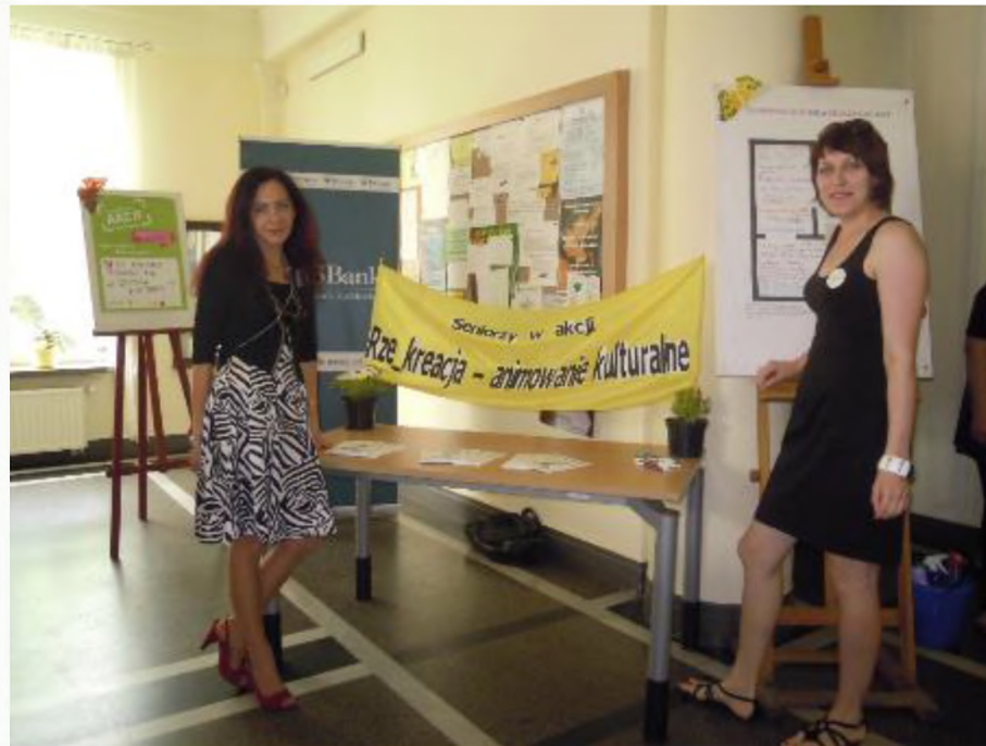
Animatorki w SP Nr 2