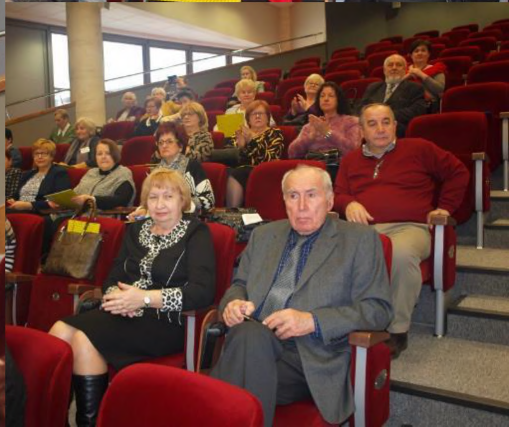
Konferencja Porozumienia Podkarpackich UTW 14.12.2018r.