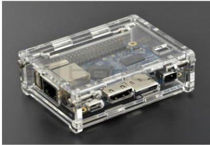
Przykładowy wygląd urządzenia