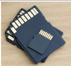
Przykładowy wygląd urządzenia