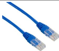
Przykładowy wygląd urządzenia