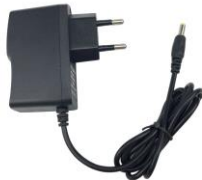
Przykładowy wygląd urządzenia