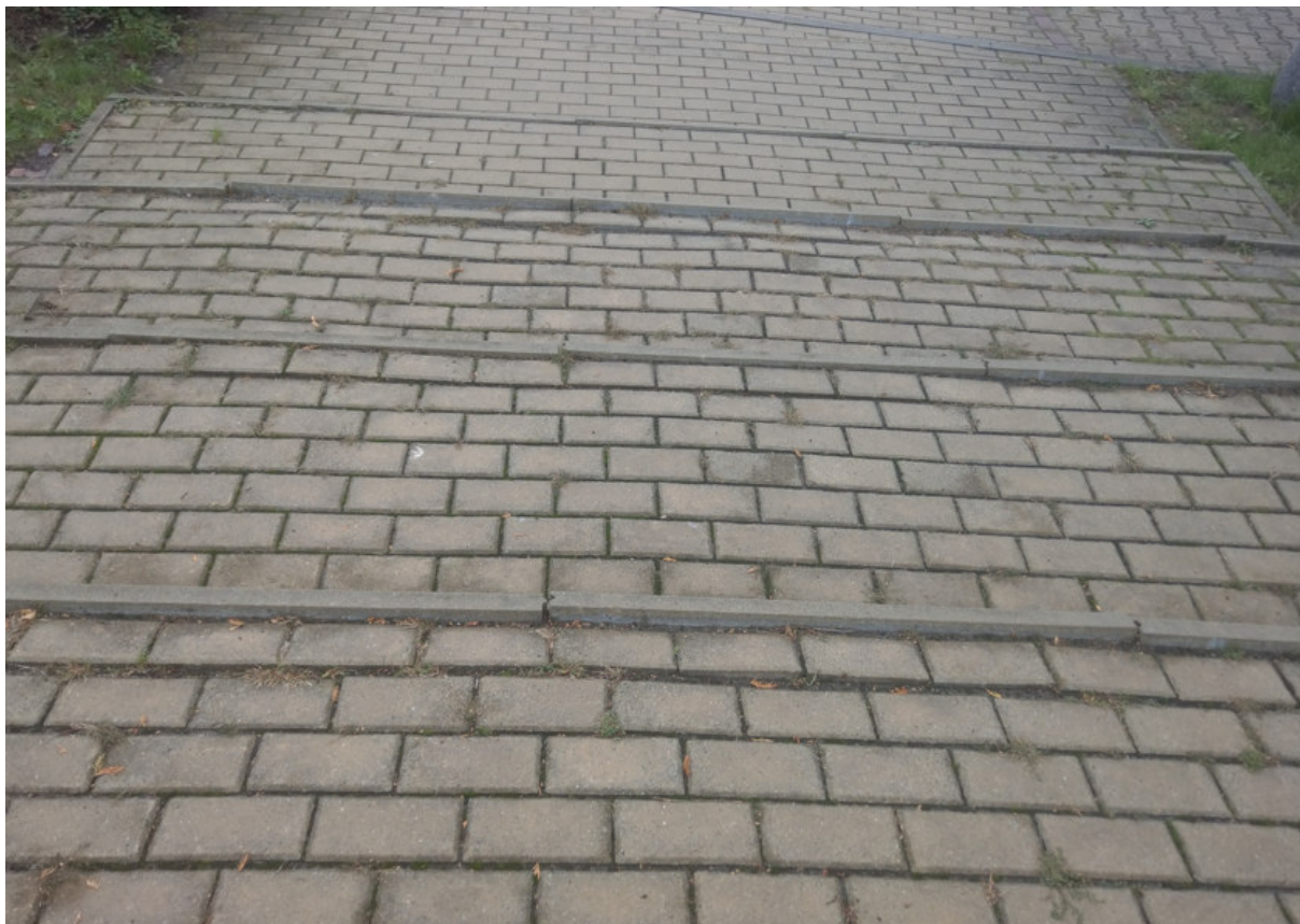
Schodach przy sali gimnastycznej budynku D1