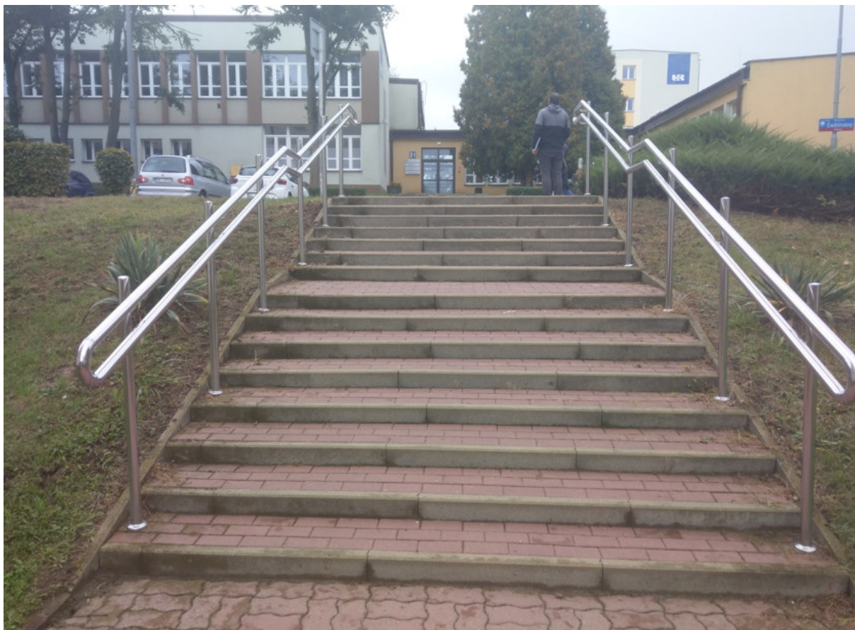
Schody zejście do Dworku budynek D2.