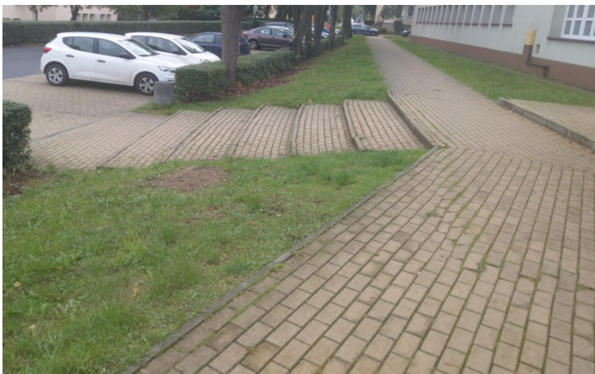
Chodnik przy sali gimnastycznej budynku D1.